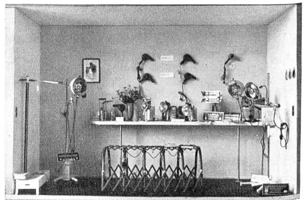
Fig. 40 Ausstellung EWZ/EKZ in Zürich. Ansicht des Standes für Elektrizität im Dienste der Heilkunde: verschiedene Bestrahlungslampen, Heissluftduschen und Lichtbäder. Exposition des EWZ/EKZ à Zurich. Vue du stand de l'électricité au service de l'hygiène: différentes lampes à radiation, douches à air chaud et bains de lumière.

Eine ebenfalls sehr gelungene Ausstellung, wenn auch in kleinerem Rahmen, wurde in der Zeit vom 29. Mai bis 7. Juni 1937 vom Elektrizitätswerk der Stadt St. Gallen durchgeführt. Es wurde hier besonderes Gewicht auf die Anbringung guter Werbetexte an den Wandflächen der Ausstellung gelegt,