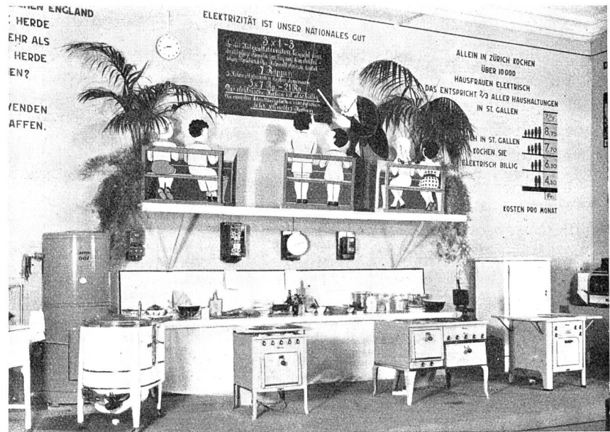
Fig. 41 Ausstellung des EW der Stadt St. Gallen mit Ansicht einer gelungenen, volkstümlichen Darstellung einer Betriebskostenberechnung für die Elektroküche.

werbeausstellung in Schaffhausen durchgeführt wurde, werden wir in der nächsten Ausgabe berichten Gt.