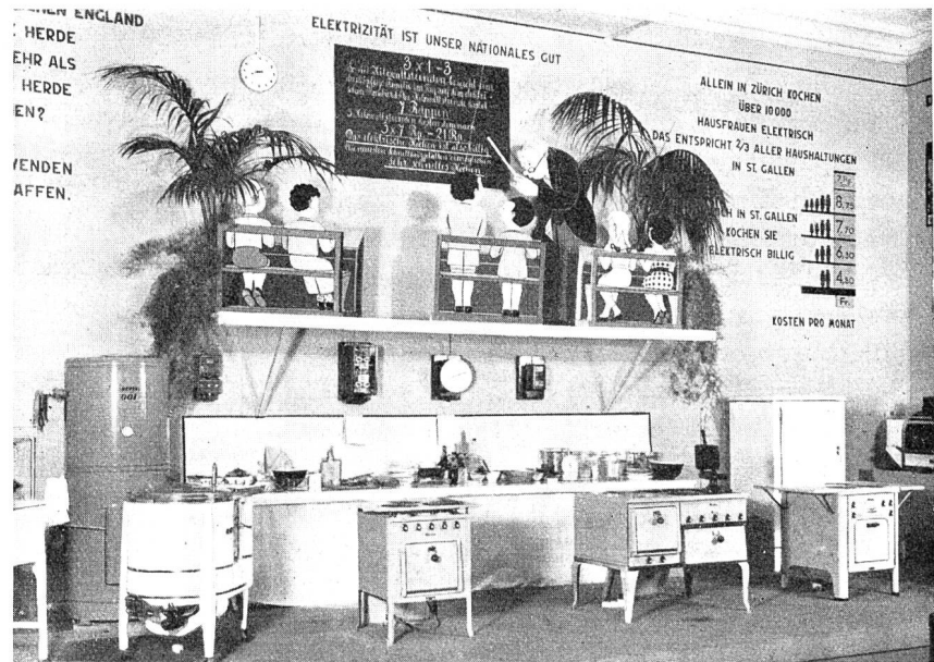
Fig. 41 Ausstellung des EW der Stadt St. Gallen mit Ansicht einer gelungenen, volkstümlichen Darstellung einer Betriebskostenberechnung für die Elektroküche.

werbeausstellung in Schaffhausen durchgeführt wurde, werden wir in der nächsten Ausgabe berichten Gt.