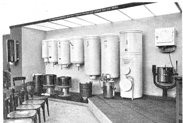
Fig. 39. Ausstellung EWZ/EKZ in Zürich. Teilansicht des Vortragsraumes mit der Darstellung des Themas «Heisswasser». Exposition des EWZ/EKZ à Zurich. Vue partielle du local des conférences avec présentation de la partie «eau chaude».

Der vom 26. April bis 13. Mai im Walchetor in Zürich abgehaltenen Ausstellung des Elektrizitätswerks der Stadt Zürich und der Elektrizitätswerke des Kantons Zürich wurde mit Berechtigung ein be-