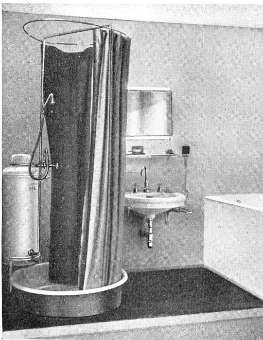
Fig. 38 Ausstellung EWZ/EKZ in Zürich. Ein Beitrag zum Kapitel «Baden». Im Vordergrund die neue, auf Anregung der EKZ geschaffene Spardusche. Exposition des EWZ/EKZ à Zurich. Coup d'œil sur le chapitre «bains». En avant, la nouvelle douche économique construite d'après les indications des EKZ.

sonderer Erfolg zuteil. Die Ausstellung war denn auch rein fachlich sehr gut aufgezogen und bot ausserdem durch eine Reihe von Vorträgen hervorragender Fachleute reichhaltige Anregungen auf den verschiedensten Gebieten der Hauswirtschaft und der Gesundheitspflege. Die Fig. 38 bis 40 geben ein Bild über die vorbildliche Anordnung der Apparate in einigen Ausstellungskojen.