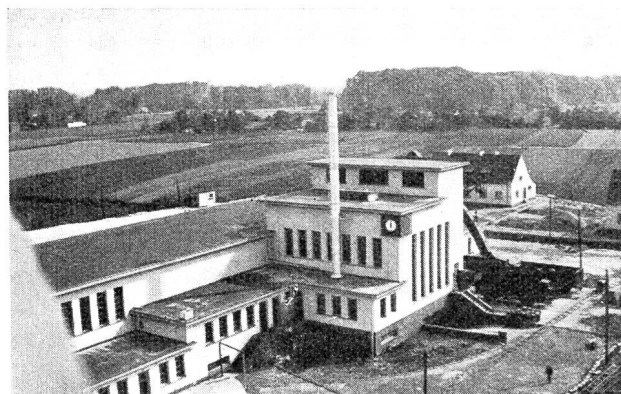
Fig. 53 Centrale à vapeur avec production d'acide carbonique (Niers).