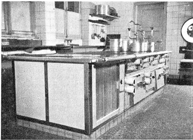
Fig. 1 Elektrische Thermo-Grossküchenanlage in einem Bahnhofbuffet des Kreises III der S. B. B.

ist, sodass nachts mit nur 8 kW aufgeheizt werden kann. Der Speicher hat den Heisswasserbedarf für den ganzen Betrieb zu decken, d. h. für Küche, Office, alle Reinigungszwecke und für die Lavabos.