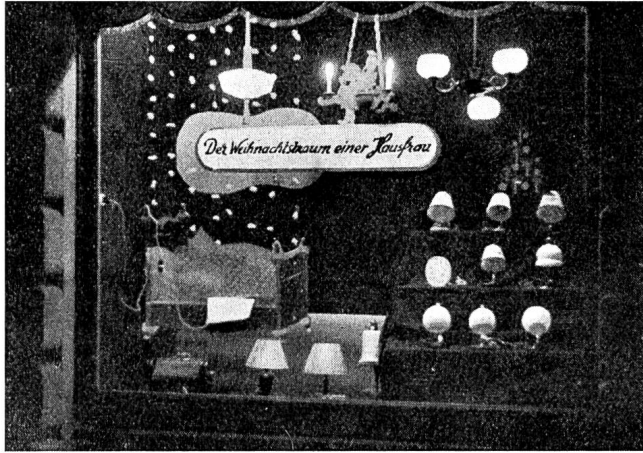
Fig. 15 Schaufenster des Elektrizitätswerks der Stadt Luzern. Vitrine du Service de l'Electricité de la Ville de Lucerne.

Nachstehend zeigen wir sechs weitere Ansichten von Schaufenster-Ausstattungen. Die sich bisher noch nicht beteiligten Werke sind nochmals zur Mitarbeit freundlich eingeladen.