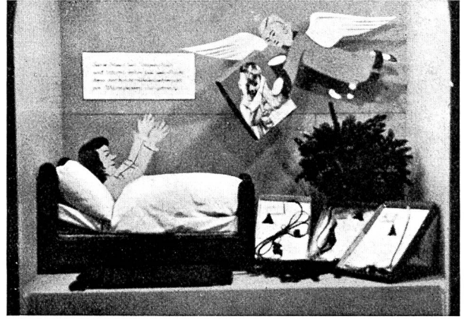
Fig. 18 Schaufenster des Elektrizitätswerks der Stadt Zürich. Vitrine du Service de l'Electricité de la Ville de Zurich.

Ci-après nous montrons six autres vues relatives à l'équipement des vitrines. Les entreprises qui pourraient encore nous envoyer d'autres photographies sont cordialement invitées à le faire.