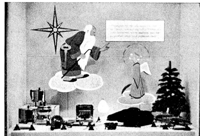
Fig. 20 Schaufenster des Elektrizitätswerks der Stadt Zürich. Vitrine du Service de l'Electricité de la Ville de Zurich.