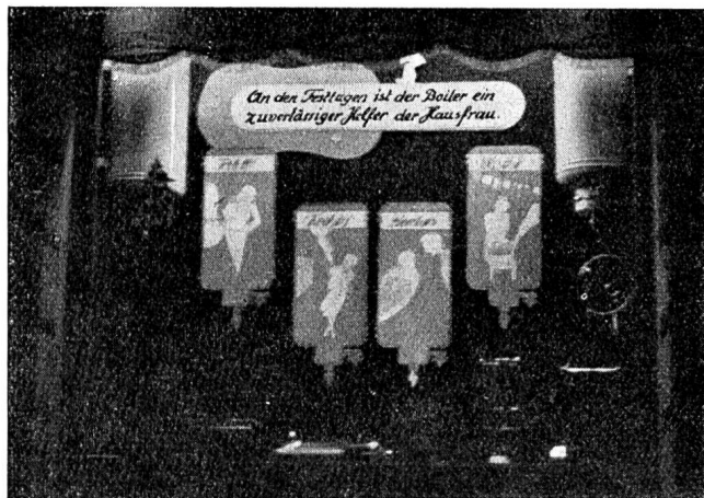
Fig. 16 Schaufenster des Elektrizitätswerks der Stadt Luzern. Vitrine du Service de l'Electricité de la Ville de Lucerne.