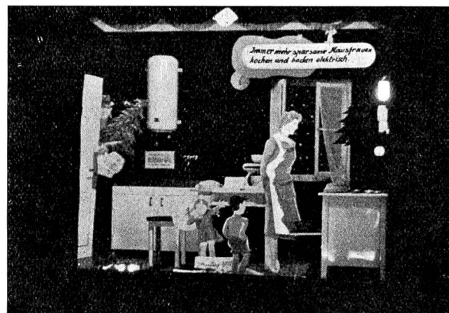
Fig. 17 Schaufenster des Elektrizitätswerks der Stadt Luzern. Vitrine du Service de l'Electricité de la Ville de Lucerne.