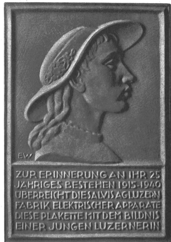
Fig. 31 Wiedergabe der durch die Salvis A.G., Luzern, anlässlich ihres 25jährigen Bestehens herausgegebene künstlerische Erinnerungplakette, die in einem Salvis-Keramikofen hergestellt wurde.

Die interessanten und zeitgemässen Vorträge werden demnächst in einem Sonderheft der internationalen Zeitschrift «Elektrizitäts-Verwertung», die von der «Elektrowirtschaft» herausgegeben wird, erscheinen.