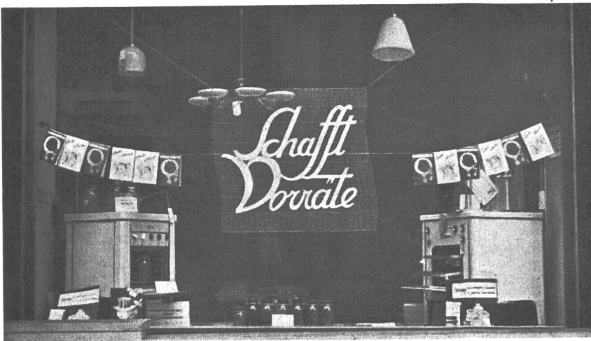
Fig. 33 Diese Ausstattung war der Vorräteschaffung gewidmet. Das Sterilisieren und Dörren im elektrischen Bratofen, sowie das Dörren im elektrischen Dörrapparat wurden dargestellt, ebenso das Sterilisieren im Topf und das Kocheneinfüllen von Beeren und Früchten auf dem elektrischen Herd.

In der permanenten Baufachausstellung der Schweizer Baumuster-Centrale (SBC) in Zürich steht der «Elektrowirtschaft» ausser drei Räumen ein Schaufenster zur Verfügung, das für die Ausstellung elektrischer Apparate reserviert ist. Die Figuren 33–35 zeigen drei verschiedene Ausstattungen des Fensters.