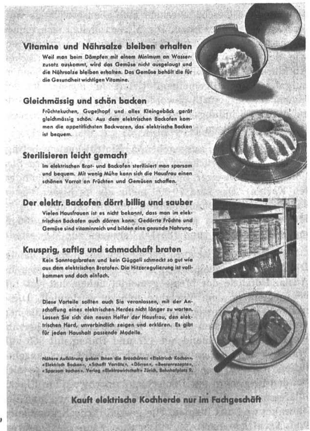
Fig. 32 Es fehlte bisher an einem einfachen Flugblatt, das in konzentrierter Zusammenstellung die Vorteile der elektrischen Küche darlegte. Auf vielseitigen Wunsch hat die «Elektrowirtschaft» nun oben wiedergegebenes Flugblatt (Format 210x297 mm) geschaffen, das sich gut zur Massenverteilung eignet. Preisangebote durch die «Elektrowirtschaft»-Bahnhofplatz 9, Zürich 1. — Dieses Flugblatt erscheint demnächst auch in französischer Sprache.