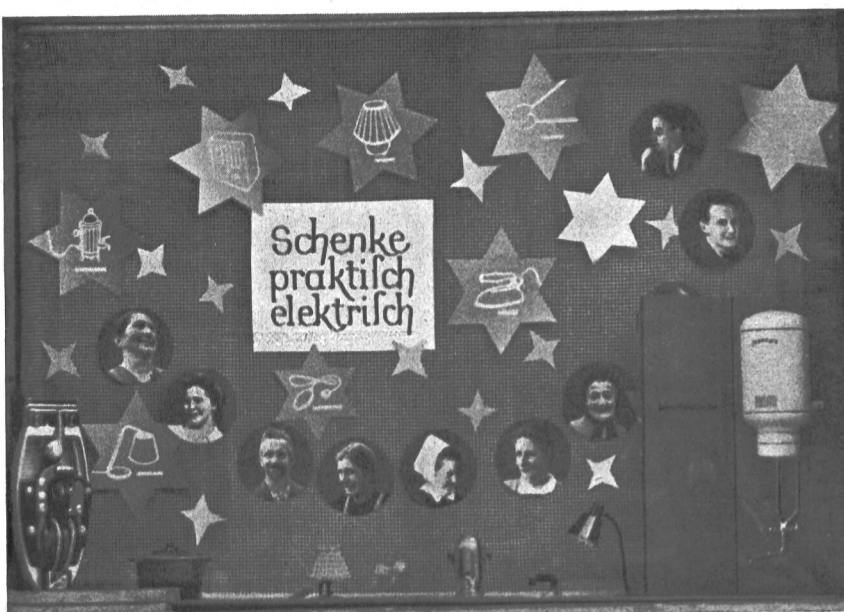
Fig. 35 Das Weihnachtsschaufenster stand unter dem Motto «Schenke praktisch, elektrisch».