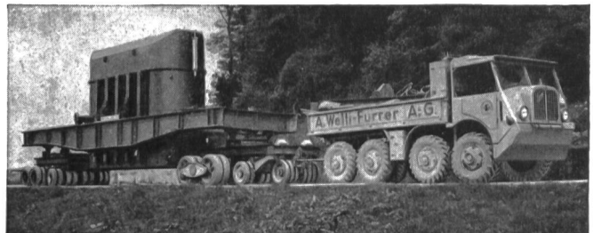
Transport eines Transformators von über 70 Tonnen Gewicht