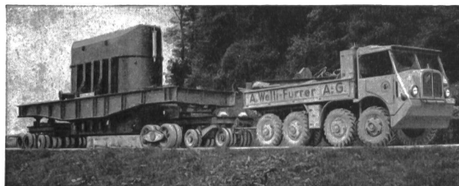
Transport eines Transformators von über 70 Tonnen Gewicht