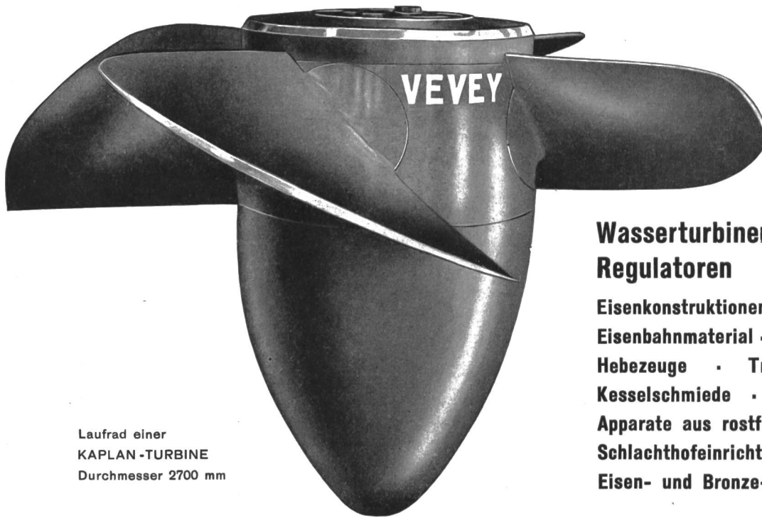
Lauf­rad einer KAPLAN-TURBINE Durchmesser 2700 mm