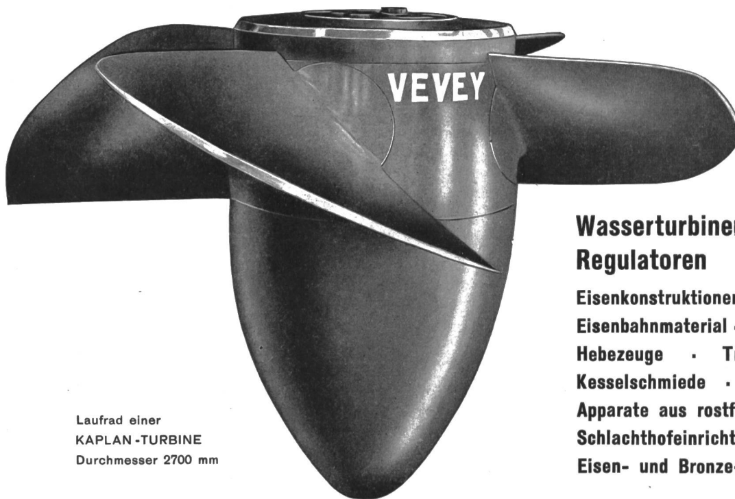
Lauf­rad einer KAPLAN-TURBINE Durchmesser 2700 mm