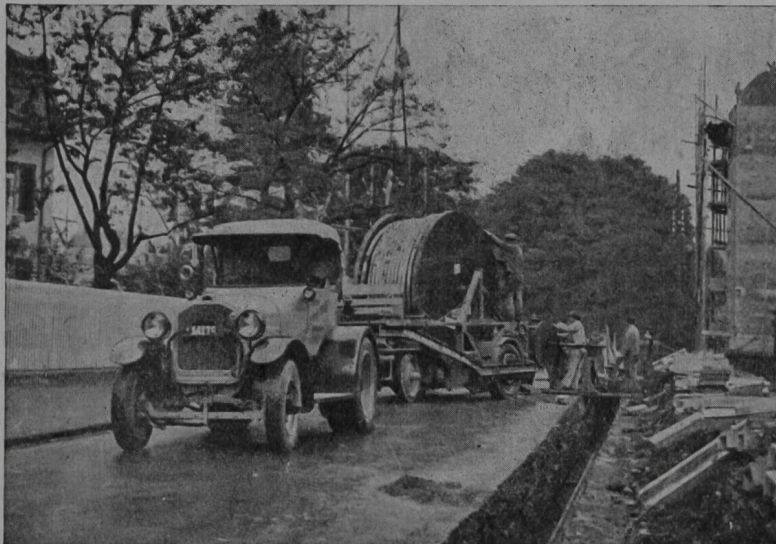
Verlegung von 6-kV-Kabeln 3 \times 240 \text{ mm}^2 für das Elektrizitätswerk der Stadt Bern.