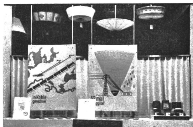
Fig. 67 Die Firma Grossenbacher & Co., Elektrische Unternehmungen, St. Gallen, hat die sechs Schaufenster ihres Ladengeschäftes durch die Firma Walter Herzog, Reklame- und Verkaufsberatung, St. Gallen, mit Bildern und Texten aus dem Schriftchen «Hilf aufklären!» ausgestalten lassen. Die obigen zwei Bilder zeigen zwei der Schaufenster.