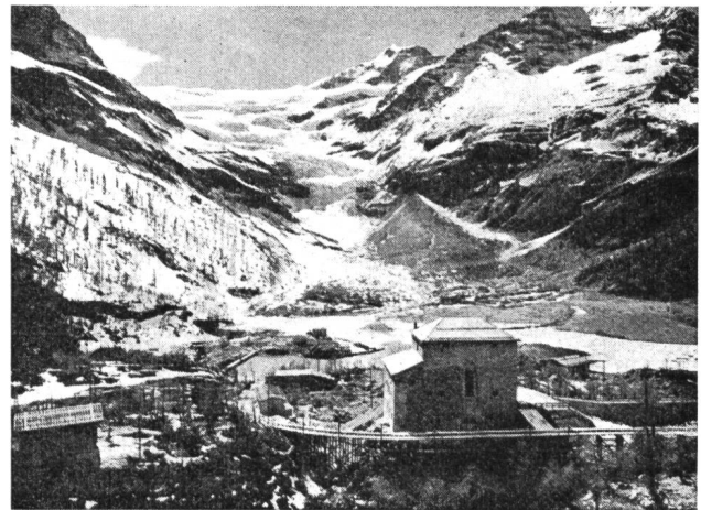
Abb. 3 Speicherkraftwerk Palù der Kraftwerke Brusio A.-G., mit dem Ausgleichbecken. Im Hintergrund Piz Palù mit Gletscher. (Nr. 7141 BRB 3. 10. 1939)

Da die Berninaseen in einem schönen, von Touristen der ganzen Welt rege besuchten Landschaftsgebiet liegen, war von den Behörden der Höherstau der Seen nur unter der wesentlichen Bedingung genehmigt worden, dass jeweils bis zum 10. Juli der Seespiegel mindestens die Kote 2232,16 erreicht habe. Damit diese Vorschrift sicher erfüllt werden kann, wurde die künstliche See-Auffüllung durch die beschriebene Speicherpumpenanlage verlangt.