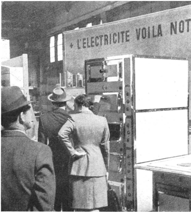
Fig. 32 In der Abteilung «Grossküchenapparate» war ständig reges Interesse für alle Apparate. Hier ein Käufer für einen Brat- und Backofen.