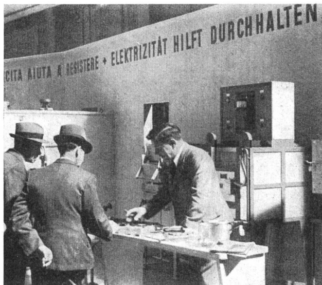
Fig. 34 Gewerbliche Kleinapparate, wie elektrische Lötcolben, Schmelztiegel und Trockenapparate, waren sehr gefragte Artikel.

Alles in allem konnte festgestellt werden, dass die gesamte schweizerische Elektroindustrie anlässlich der diesjährigen letzten Kriegsmustermesse in Basel sich in äusserst vorteilhafter Weise präsentiert hat. Es ist besonders aufgefallen, wie noch im sechsten