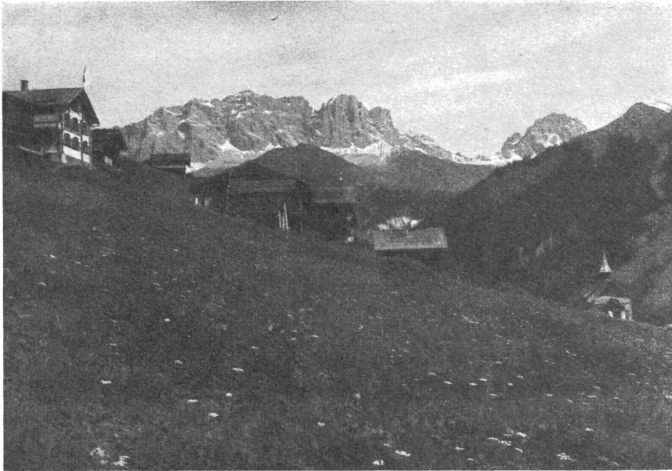
Schuders im Prätigau mit Drusenfluh und Sulzfluh.

Das idyllisch-romantisch gelegene Bergdörflein ist durch weitgreifende Rutschungen vom Untergange bedroht. (Siehe Bericht über die Exkursion zu den Berghangentwässerungen im Prätigau vom 4. bis 6. Oktober 1945, Seite 9.)