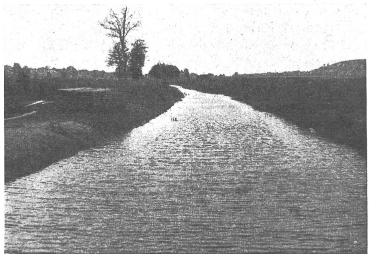
Abb. 27 Aufstau im Kanal Süd

In hydraulischer Hinsicht wurden durch die vorbeschriebenen Anlagen die Verhältnisse in zufriedenstellender Art geordnet. Aber es ist damit noch nicht alles erreicht. Es zeichnet sich ein weiteres Problem deutlich ab, und dieses besteht in der Schaffung des notwendigen Windschutzes. Auch hier ist bei richtiger Zusammenarbeit die Lösung möglich durch Anlage eines Wegnetzes senkrecht zur Windrichtung und Baumpflanzung auf der Ostseite dieser Wege. Dies ist oft nur durchführbar in Verbindung mit der Güterzusammenlegung, die weitere grosse Vorteile bringen würde. Es handelt sich um grosse Änderungen; aber die Bevölkerung hat aus dem frühern Sumpf ein hochwertiges Kulturgebiet geschaffen und wird es weiter verbessern. Die Einsicht ist da, und die Jungen werden auch Mittel und Wege finden, um das erkannte Ziel zu erreichen.