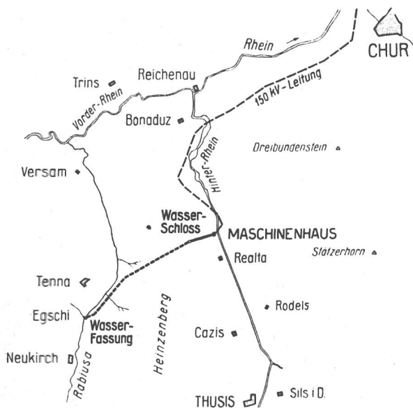
Abb. 1 Lageplan. Maßstab 1 : 250 000.

Die Energieerzeugungsmöglichkeit erreicht rund 115 Mio kWh/Jahr, wovon etwa ein Drittel auf den Winter und zwei Drittel auf den Sommer entfallen. Die Baukosten belaufen sich mit Einschluss der Abtransformierungsanlage auf rund 30 Mio Fr. Das Bauprogramm sieht eine Bauzeit von rund 2½ Jahren vor. Die Betriebseröffnung ist auf den Herbst 1949 in Aussicht genommen.