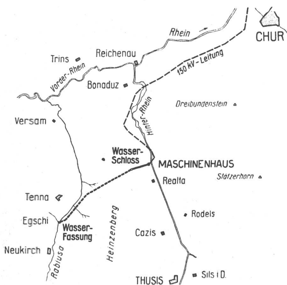
Abb. 1 Lageplan. Maßstab 1 : 250 000.

Die Energieerzeugungsmöglichkeit erreicht rund 115 Mio kWh/Jahr, wovon etwa ein Drittel auf den Winter und zwei Drittel auf den Sommer entfallen. Die Baukosten belaufen sich mit Einschluss der Abtransformierungsanlage auf rund 30 Mio Fr. Das Bauprogramm sieht eine Bauzeit von rund 2½ Jahren vor. Die Betriebseröffnung ist auf den Herbst 1949 in Aussicht genommen.