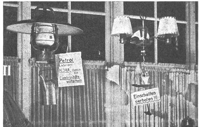
Fig. 3 Schaufensterbeleuchtung 1947.

Dieser Stand hat sicher seine Wirkung nicht verfehlt. Die Möglichkeit, dass jeder Besucher selber experimentieren konnte, hat die beabsichtigte Instruktion ohne Zweifel eindrücklich gemacht. Der Spielbetrieb im Menschen und besonders im Manne ist gross und jede Darstellung, die ihm entgegenkommt, wird auf Erfolg stossen. Idee und Ausführung dieser Darstellung ist einfach und gut und vermag sicher Anregungen zu vermitteln.