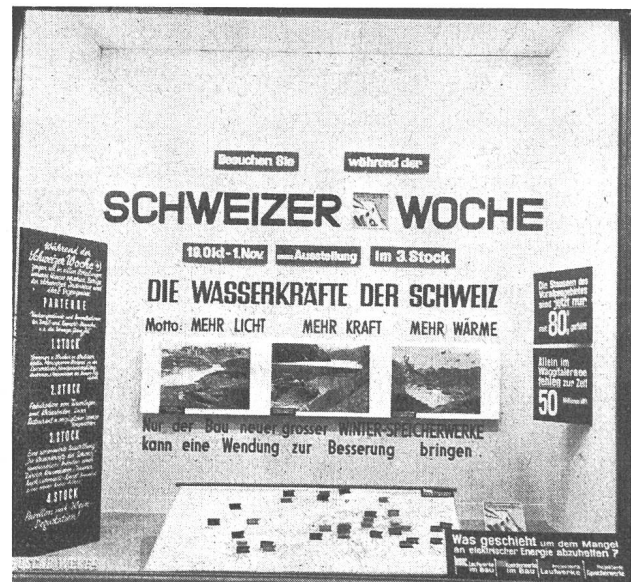
Fig. 26 Ansicht des Schaufensters mit Blickfang und Karte mit Kraftwerken, die im Bau und die projiziert sind.

Die Elektrizität oder sie umgebende Zusammenhänge können nun aber nicht wie ein Waschmittel oder ein Lippenstift bildhaft gemacht werden. Während die Gasindustrie z. B. die Möglichkeit hat, die Flamme des brennenden Gases zu verwenden — was auch ausgiebig ge-