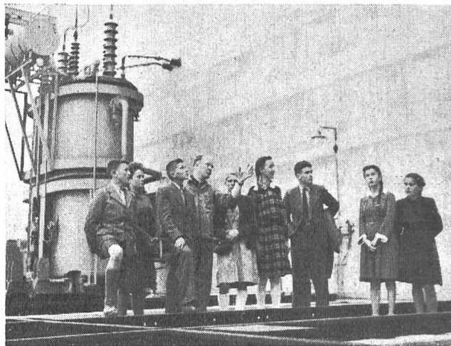
Fig. 28 Der Maschinist erläutert die Freiluftanlage.

allgemeinen wird aber in dieser Beziehung zu viel Zurückhaltung geübt.