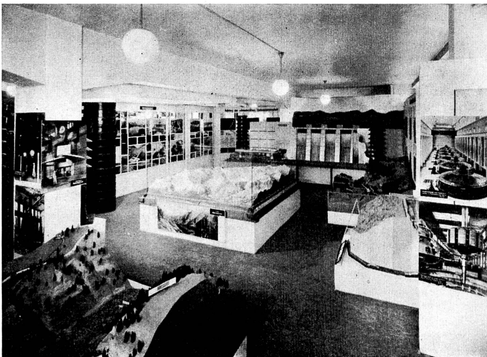
Fig. 7 Blick in die Ausstellung «Die Wasserkräfte der Schweiz» im Warenhaus Oskar Weber in St. Gallen.

Die Ausstellung «Wasserkräfte der Schweiz» hat ohne Zweifel einer grossen Zahl von Besuchern einen Eindruck vermitteln können von den Leistungen unserer Elektrizitätsunternehmen in den letzten Jahren und von der regen Tätigkeit, die heute im Kraftwerkbau herrscht. Wenn sie darüber hinaus auch ein wenig dazu beigetragen hat, Verständnis für die Notwendigkeit zu wecken, dass das ganze Schweizervolk den weiteren Kraftwerkbau unterstützt, so hat diese Schau ihren Zweck erfüllt. Der Firma Oskar Weber gebührt Dank für die Durchführung dieser Ausstellungen.