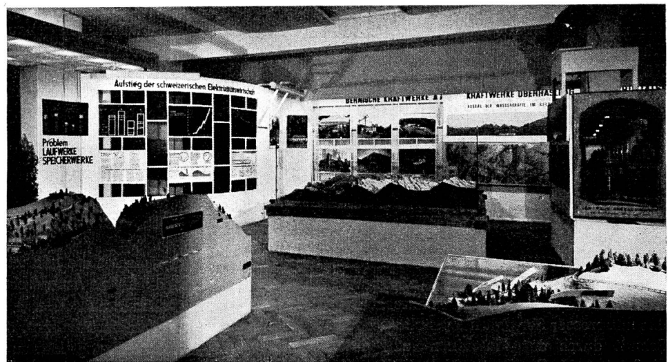
Fig. 9 Ein anderer Aspekt der Schau in Bern. Links im Hintergrund erkennt man einige Darstellungen über allgemeine energiewirtschaftliche Fragen.