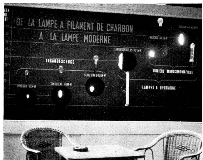
Fig. 21 Le tableau montrant les progrès de la lumière électrique.

En résumé, le stand conçu cette année sur une base thématique a causé une bonne impression et en contribuant à faire connaître le gros effort entrepris en vue d'accroître rapidement et par tous les moyens la production d'électricité, il paraît avoir rempli l'une de ses principales missions.