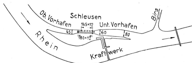
Fig. 3 Birsfelden sur le Haut-Rhin, projet.