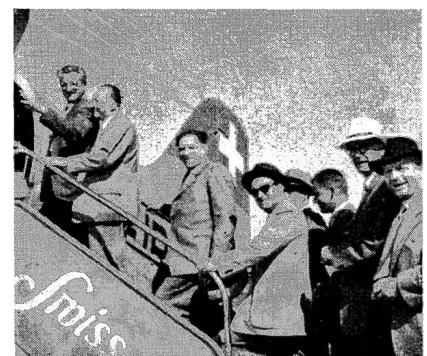
Fig. 23 Einsteigen zum Rundflug.