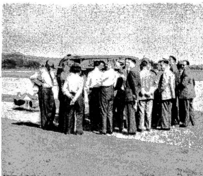
Fig. 21 Erläuterung der Blindlandepiste.

Die Aussprache über dieses Referat, das in der vorliegenden Nummer der «Schweizer Elektro-Rundschau» leicht gekürzt wiedergegeben ist, zeigte, dass bei verschiedenen Werken den Wünschen der Waldwirtschaft Verständnis entgegengebracht wird. Wie man den Ausführungen von anwesenden Vertretern der Elektroapparateindustrie ent-