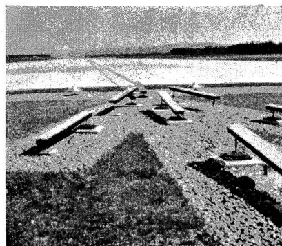
Fig. 22 Blindlandepiste. Im Vordergrund neonbeleuchteter Pfeil.