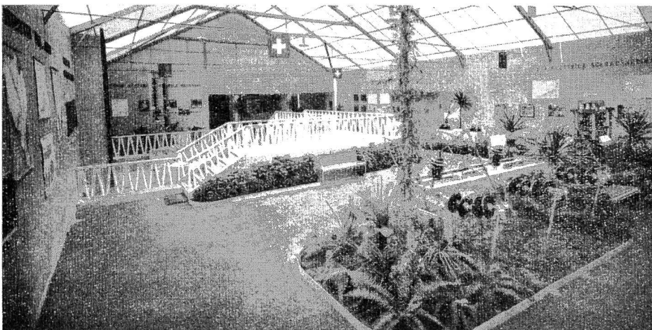
Fig. 34 Ansicht des Pavillons gegen den Eingang. Mit Blumen und Pflanzen ist die Ausstellung aufgelockert worden.