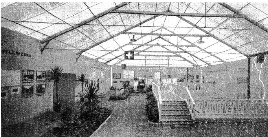
Fig. 33 Generalansicht des Elektrizitätspavillons vom Eingang aus.

Tessiner Weine und die Tessiner Landwirtschaft waren dieses Jahr wieder vertreten, was ein erneuter Beweis des Willens der Veranstalter und der Aussteller war, das Leben und die Landwirtschaft des südlichen Kantons vollständig zu zeigen.