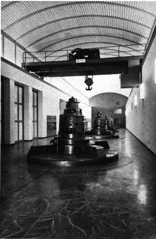
Abb. 3 Inneres der Zentrale Verbano mit vier Maschineneinheiten. Durch den schöngezeichneten grünen Marmorboden und die orangefarbenen Stirnwände wirkt der Kavernenraum sehr ansprechend.

auf Depot gelegt werden, weil die Kiessandgewinnungsstelle nachher überstaut wird.