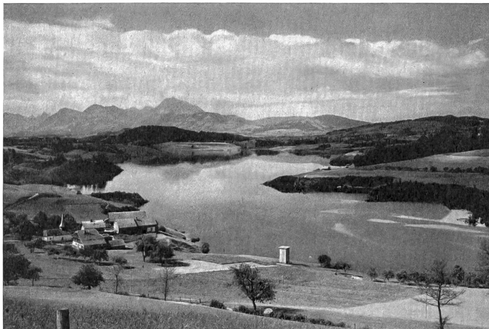
Fig. 1 Le lac de la Gruyère près de Thusy