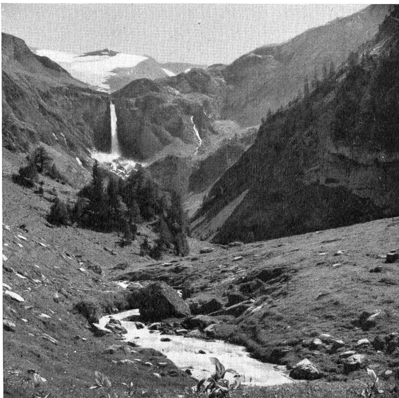
Geltenbachfälle, im Einzugsgebiet der oberen Saane, durch Beschluß des bernischen Regierungsrates vom Dezember 1956 geschützt und der Wasserkraftnutzung entzogen

On constate que la libre Sarine, que célèbre la chanson, est domestiquée de plus en plus. Elle n'en est que plus chère au cœur du Fribourgeois, l'énergie qu'elle apporte étant un élément important du progrès industriel et du confort ménager du pays.