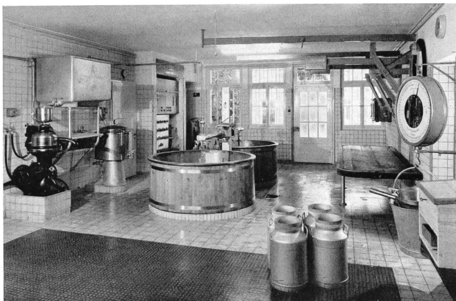
Bild 4 Elektrische Käserei in Escholzmatt, erstellt in den Jahren 1950/51

Die CKW unterhalten seit etwa 30 Jahren einen Beratungsdienst für ihre Kundschaft. Spezialisierte Kochlehrerinnen besuchen regelmäßig die ländlichen Haushaltungen mit elektrischen Küchen, um den Hausfrauen neue Rezepte zu vermitteln und ihnen über Anfangsschwierigkeiten hinwegzuhelfen. — Den Landwirten steht der Versuchshof in Rothenburg und den Gärtnern die Versuchsgärtnerei in Rathausen zur Verfügung, wenn es darum geht, sie mit neuen Apparaten und Kulturverfahren bekannt zu machen. Dieser Beratungsdienst steht allen Kunden jederzeit zur Verfügung. — Seit mehr als 20 Jahren unterhalten die CKW ein agrikulturchemisches Laboratorium mit dem Zweck, für die Landwirte unentgeltliche Bodenanalysen durchzuführen. Die Landwirte und Gärtner wissen diesen Dienst zu schätzen, werden doch alljährlich über 1000 Bodenproben aus dem Abder Analysen können die Interessenten hinsichtlich rationeller Düngungsmaßnahmen beraten werden. Dieser Dienst erlaubt es ihnen, bessere und höhere Erträge herauszuwirtschaften und sie für oft benötigte Durchleitungsrechte und für das Aufstellen von Stangen und Masten zugänglicher zu machen. Höhere und bessere satzgebiet auf ihren Chemismus untersucht. Auf Grund Erträge bringen vermehrte Einnahmen, so daß sich der alte Spruch «Hat der Bauer Geld, so hat's die ganze Welt» wieder einmal mehr bewahrheitet.