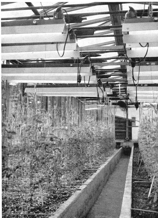
Bild 3 Pflanzenbestrahlung im Treibhaus mit Fluoreszenzleuchten verschiedener Wellenlänge, 2900° — 3500° K.

Grastrocknung von großer wirtschaftlicher Bedeutung. In der Schweiz gehen jährlich enorme Nährwerte durch die Mißgunst des Wetters während der Heuernte verloren. Geldwertmäßig ausgedrückt, belaufen sich diese Verluste Jahr für Jahr auf 110 bis 130 Mio Franken. Dafür müssen jährlich bedeutende Kraftfuttermengen