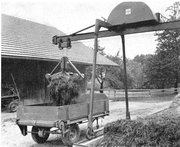
Bild 2 Elektrischer Mistaufbläser

Der Elektromotor ist zu einer besonders wertvollen Hilfe des Landwirts geworden. Er ermöglicht die Inbetriebsetzung von gegen 40 verschiedenen Hilfsgeräten. Es handelt sich um Manipulationen, die längst bekannt sind und nicht besonders hervorgehoben werden müssen. Dagegen geben einige andere Anwendungen mit spezifisch hygienischem Aspekt Anlaß zur näheren Erörterung. Es betrifft dies: die elektrische Melkmaschine, die automatische Stallventilation, die Viehreinigungsmaschinen und die Mistförderanlagen. Diese Anlagen müssen täglich in Betrieb gesetzt werden, so daß sich eine sehr günstige und rationelle Gebrauchsdauer ergibt, was nicht von jeder landwirtschaftlichen Maschine behauptet werden kann. Die elektrische Mistlademaschine ist besonders vorteilhaft, weil sie gestattet, 60 q Mist in 10 Minuten aufs Fuder zu laden, was einer 50prozentigen Einsparung an Zeit und Handarbeit entspricht.