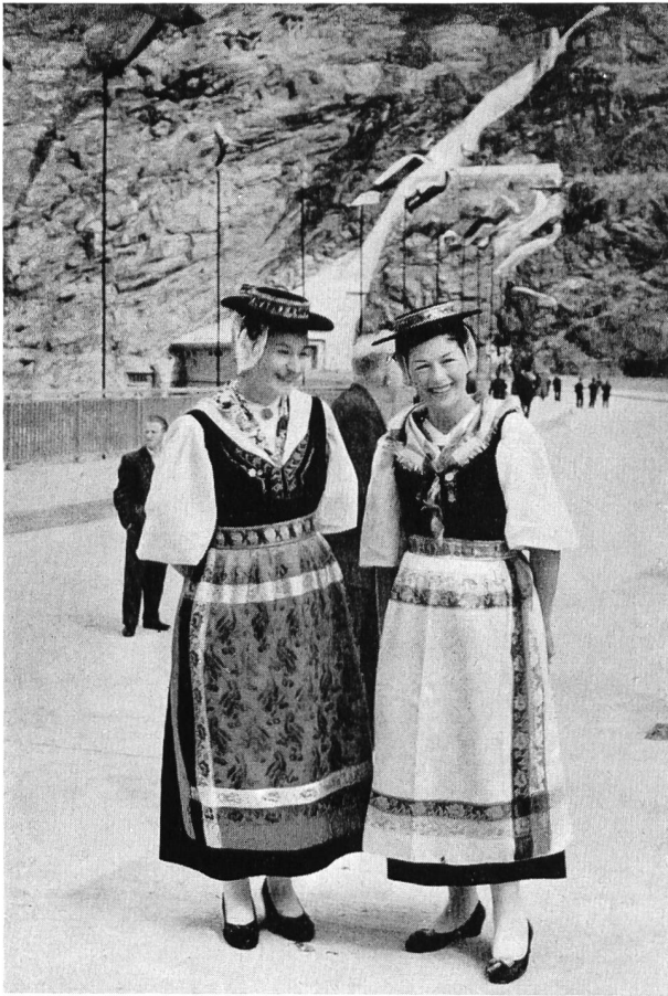
Bild 5 Zwei Walliserinnen anlässlich der Einweihung

September 1947 gegründeten Société des Forces Motrices de Mauvoisin S. A. , Sion, auch mit der Detailbearbeitung und der Bauleitung betraut 1 . Das Aktien-