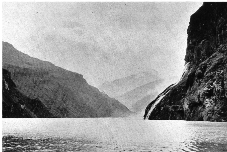
Bild 1 Der im Herbst 1958 erstmals gefüllte Stausee Mauvoisin, rechts Einleitung des vom Corbassière-Gletscher zugeführten Wassers