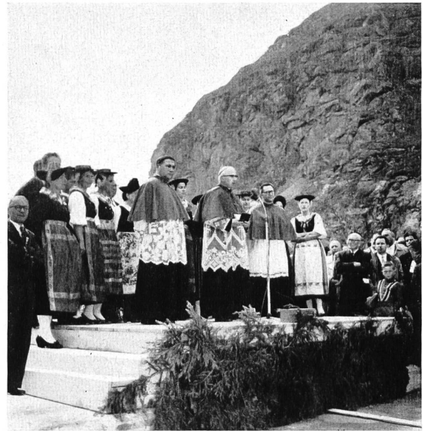
Bild 3 Einsegnungs-Zeremonie durch S. E. Mgr. Haller, Abt von Saint-Maurice; im Hintergrund Trachtengruppe der «Chanson Valaisanne»

ü. M.; das vom Corbassièregletscher zugeführte Wasser stürzt in schönem, neugeschaffenem Wasserfall in den milchiggrauen langen Stausee von 180 Mio m 3 nutzbarem Stauinhalt; dieser entspricht einer gespeicherten Energie von rund 540 GWh. Mit 237 m größter Höhe stellt das imposante Sperrenbauwerk die höchste Bogenstaumauer der Welt — gegenwärtig, Irrtum vorbehalten, sogar die höchste Staumauer überhaupt — dar; wahrlich, ein bewundernswertes Zeugnis für den Wagemut und die Tatkraft schweizerischer Ingenieurkunst und kühnen Unternehmegeristes.