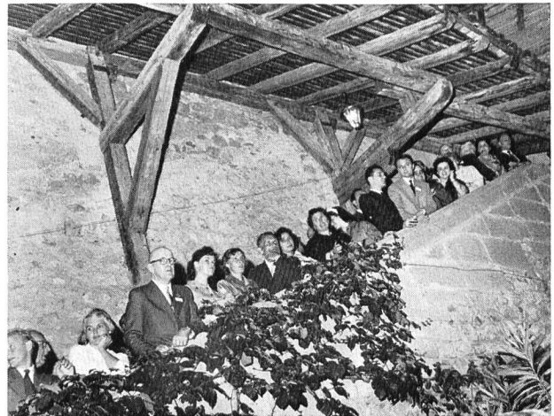
Bild 3 Auf dem Weg zur Besichtigung der verschiedenen Säle im Schloß Chillon

Gruppe 2: Fahrt nach Locarno und zweitägiger Aufenthalt mit Besichtigung der Maggia- und Blenio-kraftwerke; Ausflüge u. a. auf die Inseln von Brissago, den Monte Generoso und nach Lugano. Rückfahrt über Gotthard (Besichtigung des Lucendo-Werkes), Sustenpaß, Interlaken, Gstaad.