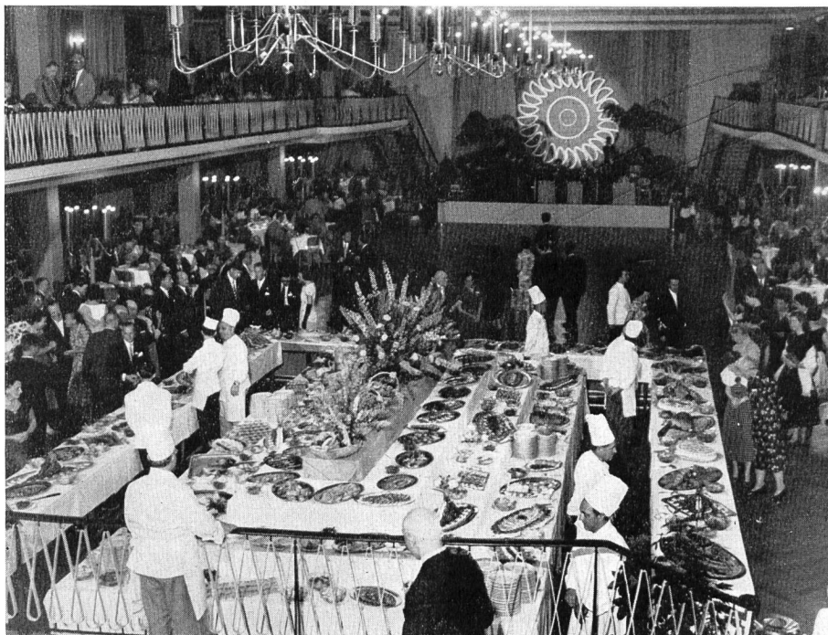
Bild 4 Erlesenes Buffet im Zeichen der Turbine

Der wohlgelungene Kongreß schloß mit dem Abschieds-Dîner im Palais de Beaulieu am Abend des 8. Juli 1958, wo die Kongreßteilnehmer noch Gelegenheit hatten, ihre Eindrücke über die verschiedenen Exkursionen und Besichtigungen auszutauschen.