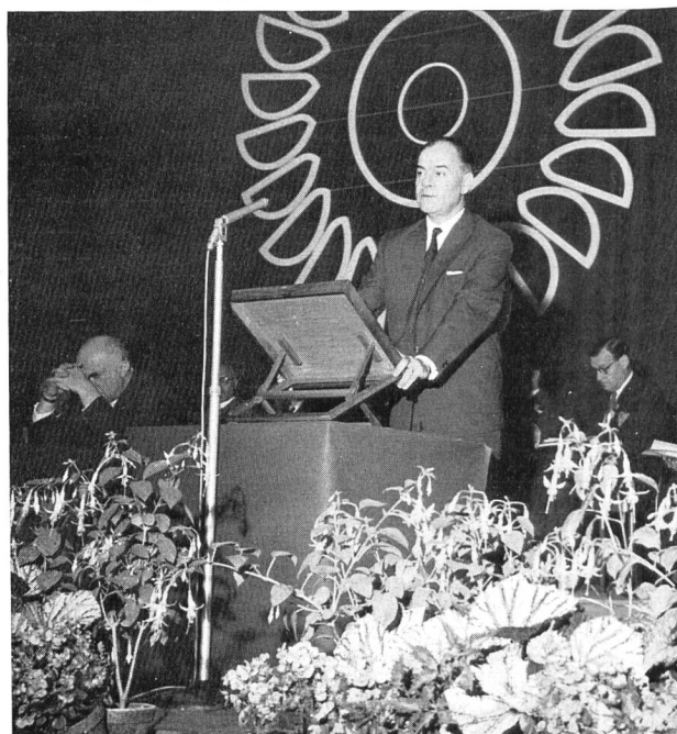
Bild 1 M. Denis de Rougemont während des Festvortrages

führe, daß für die verantwortlichen Stellen der Überblick über das Ganze immer schwieriger werde. Es sei deshalb wichtig, den Verantwortungssinn und das Interesse des einzelnen für die gemeinsamen Anliegen aller zu stärken.