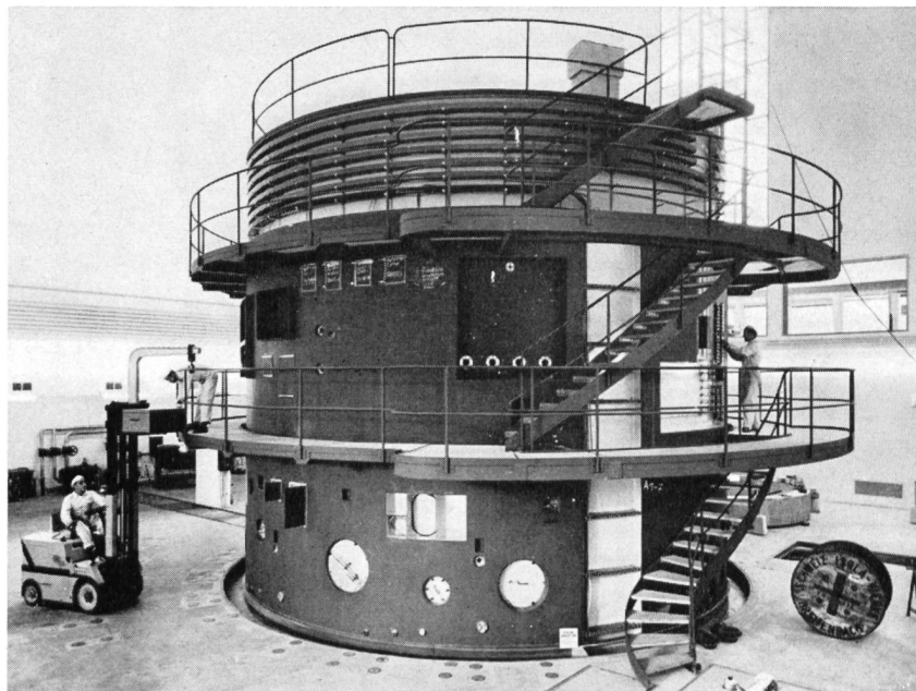
Schwerwasserreaktor «DIORIT» Montagezustand Herbst 1959

Abteilung Diorit verantwortlich ist, befaßte sich in seinen Ausführungen mit dem Betrieb und der Organisation des Schwerwasserreaktors. Die Arbeiten der Betriebsabteilung umfassen den Betrieb und Unterhalt, wobei die Sicherheit der Anlage oberstes Gebot ist, sowie die Zusammenarbeit mit den Experimentierenden. In abschließenden Ausführungen referierte W. Hunzinger über die überaus verantwortungsvolle Aufgabe und die Organisation des Strahlungsüberwachungsdienstes, welcher in fünf Gruppen unterteilt ist und zwar: Personaldienst, technischer Dienst, Forschung und Entwicklung, Meteorologie und Umgebungsüberwachung sowie analytischer Dienst.