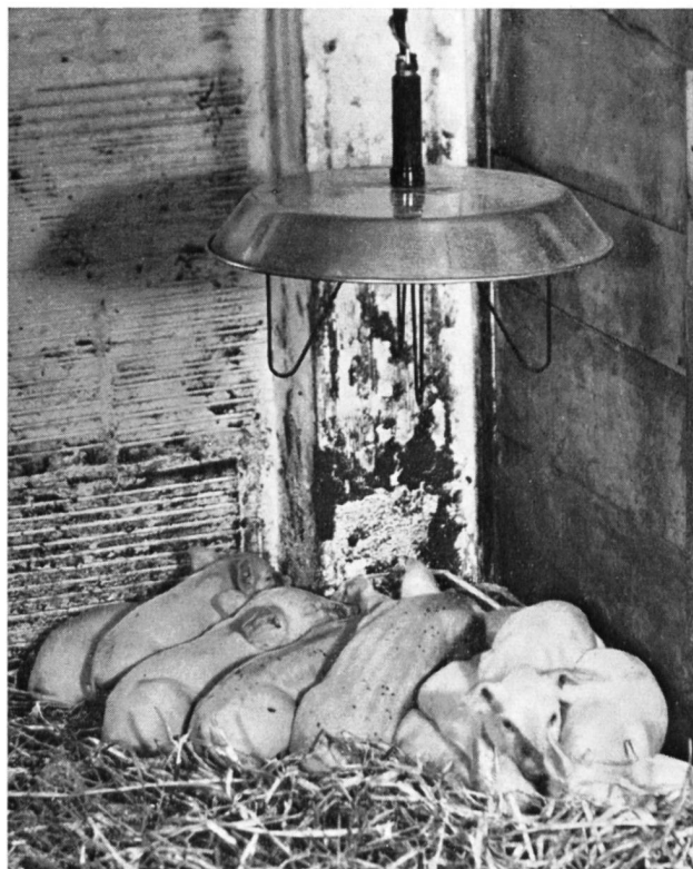
Bild 5 Infrarotstrahler; unentbehrliches Gerät in der Schweine- und Hühneraufzucht, neuerdings auch in der Kälberaufzucht sowie Kälbermast

Kochherde, Heißwasserspeicher, Futterdämpfer, Waschmaschinen und Infrarotstrahler. Die Kochherde und Waschmaschinen, die sich in den letzten 20 Jahren zahlenmäßig verfünffacht haben, tragen zur Entlastung der im Haushalt beschäftigten Personen wesentlich bei. Bei der chronischen Verknappung der landwirtschaftlichen Arbeitskräfte — die landwirtschaftlichen Dienstboten weiblichen Geschlechts haben seit