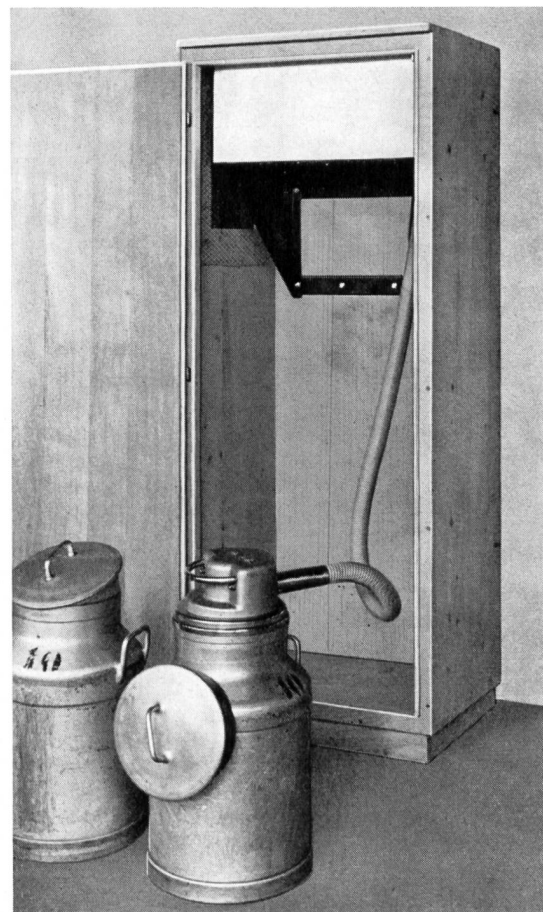
Bild 3 Der Milchkannenkühler, heute ein unentbehrliches Gerät zur Hebung der Milchqualität (Haltbarkeit)

Zu Beginn des Zweiten Weltkrieges trat die Bedeutung der Elektrowärme schlagartig in ein aktuelles Stadium. Es sei nur an die künstliche Graströcknung erinnert. Infolge Fehlens von Koks und andern, flüssigen Brennstoffen sahen sich die Energieproduzenten genötigt, bedeutende Energiemengen für diesen Zweck zur Verfügung zu stellen. Im Jahre 1950 waren noch 60 Elektrotrockner im Betrieb. Sie repräsentierten einen Gesamtanschlußwert von etwa 72 000 kW. Der Stromverbrauch belief sich auf rund 50 Mio kWh. Die Elektrotrockner gehen rasch zurück zugunsten der