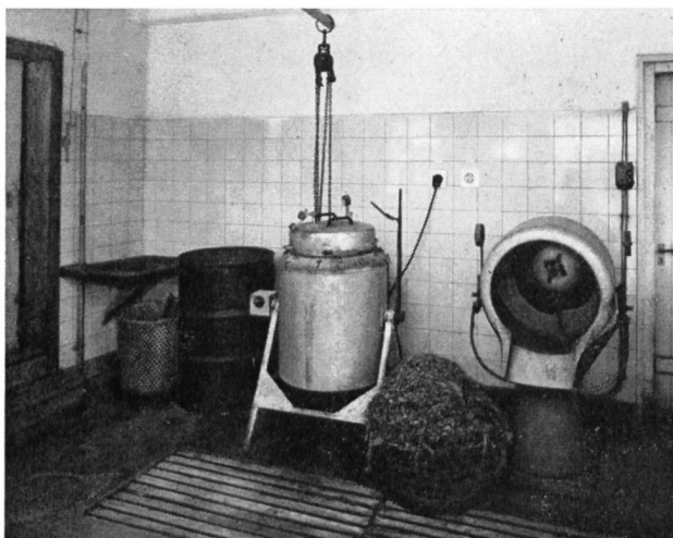
Bild 4 Futterküche für Schweine; links Futterdämpfer (Nachtstromverbraucher), rechts Muser und Mixer zur Herstellung von breiigen Futtermischungen

ölbeheizten Trockner. Heute dürften noch knapp 2 Dutzend Elektrotrockner in Betrieb stehen. (Gesamtzahl: 120 Grastrockner.)