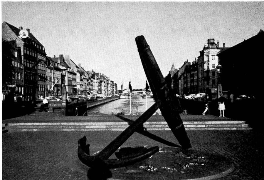
Bild 67 Im alten Hafen von Kopenhagen.

Spät abends begeben wir uns zu dem auf schmaler Insel gelegenen Flugplatz; dort müssen wir uns der unerwartet langen Flugquais wegen sehr beeilen, um noch rechtzeitig unsere Plätze im Flugzeug einnehmen zu können. Unangenehm überrascht sind wir von der hohen Flughafengebühr von 20 Kronen pro Person, die uns erbarmungslos abgeknöpft wird, nachdem wir vorher mit den dänischen Kronen so ziemlich aufgeräumt haben! Um 23.58 Uhr startet die Caravelle der SAS zu unserem letzten Flug dieser Reise, unserem Heimflug. Grossartig ist das unter uns rasch entschwindende Lichtermeer der Millionstadt. Bald fliegen wir auf 7600 m mit einer Geschwindigkeit von 800 km/h bei einer Aussentemperatur von minus 28 °C. Für die Bewältigung der 1020 km langen Strecke benötigt die Caravelle 1 Stunde 30 Minuten und um 01.28 Uhr des 19. Juli landen wir wohlbehalten im Flughafen Zürich-Kloten. Leider müssen wir noch lange warten, bis wir schliesslich im Auto von Kloten heimgefahren werden, beglückt darüber, dass