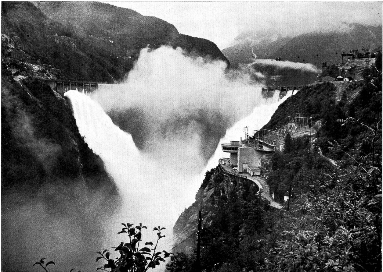
Ein Hochwasser von 400 m 3 /s stürzte am 10. September 1965 donnernd von der Talsperrenkrone in die tiefe Verzascaschlucht. (Bilder S. 367 und 368 Photos V. Vicari Lugano)

graphien zeigt vor allem die neuen Anlagen in ihrem Werdegang während sechs Baujahren und in der heutigen ästhetisch erfreulichen Vollendung.