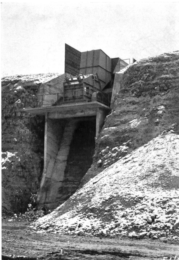
Bild 4 Prallmühle im Steinbruch Würenlingen zur Zerkleinerung des Spermülls der Region Baden-Brugg.

Neben dem immer grösser werdenden Angebot an Schlamm sind es jedoch noch andere Gründe, die sich hemmend auf den Absatz an Faulschlamm an die Landwirtschaft auswirken. Es sind die Bedenken seitens der Milch- und Veterinärhygieniker in Bezug auf Klärschlamm-düngung der Futterwiesen. Es wird darauf hingewiesen, dass auch der ausgefaulte Schlamm nicht gänzlich frei von pathogenen Keimen und Wurmeiern ist, so dass die Möglichkeit einer Schliessung der Infektionskette und damit einer Uebertragung von Krankheiten auf Tier und Mensch grundsätzlich besteht. Obschon solche Schadenfälle, verursacht durch ausgefaulten Schlamm, unseres Wissens