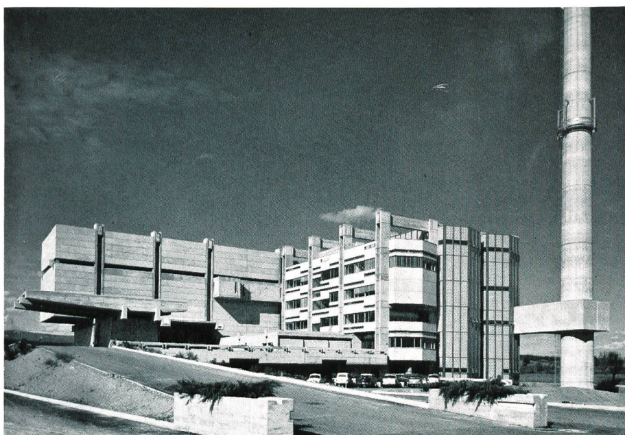
Bild 1 Auch eine Müllverbrennungsanlage kann architektonisch reizvoll gestaltet werden, wie das Beispiel der Anlage Genève-Les Cheneviers zeigt.

Die Stadt Basel erstellte im Jahre 1943 ihre Verbrennungsanlage. Sie wird in den nächsten Jahren ebenfalls weiter ausgebaut.