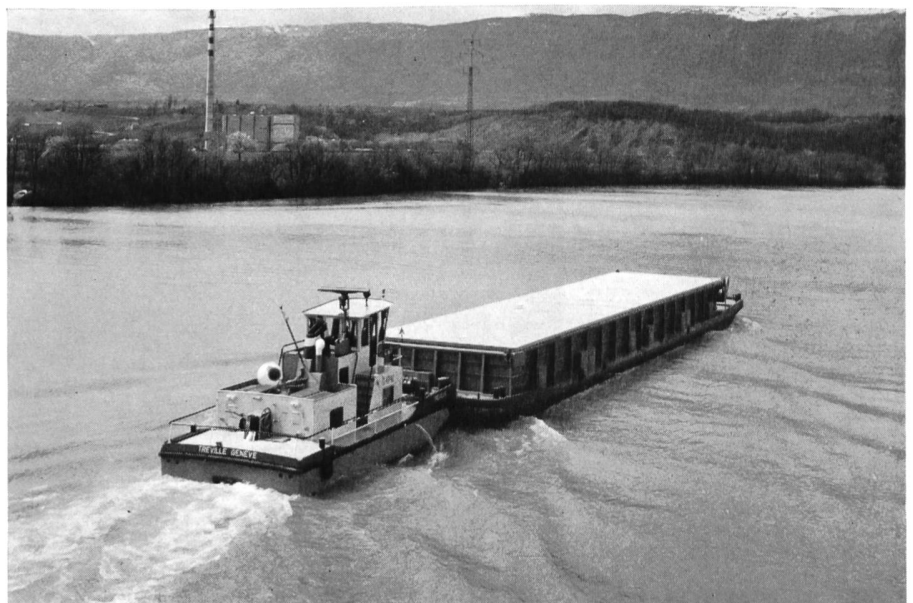
Bild 2 Mülltransport per Schiff zur Verbrennungsanlage Genève- Les Cheneviers: Schubboot und Müllbarge beim Manövrieren auf der Rhone bei La Jonction; am Ufer die Verbrennungsanlage.

Wenden wir uns den unappetitlichsten Abfallstoffen zu, den Kadavern, Konfiskaten und Schlachthofabfällen.