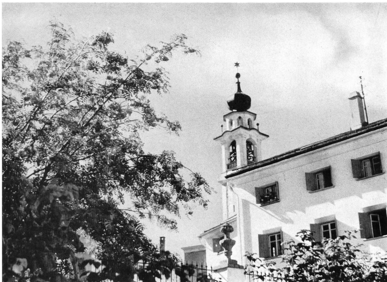
Bild 2 Gemeindehaus — ehemaliges Plantahaus — und barocker Kirchturm von Samedan.