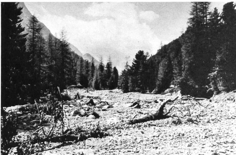
Bild 20 Hochwasserverheerungen 1954 im mittleren Rosegtal. Teile der schönen Alpweiden des besten Alpgebietes von Samedan wurden wohl für Jahrzehnte vernichtet.