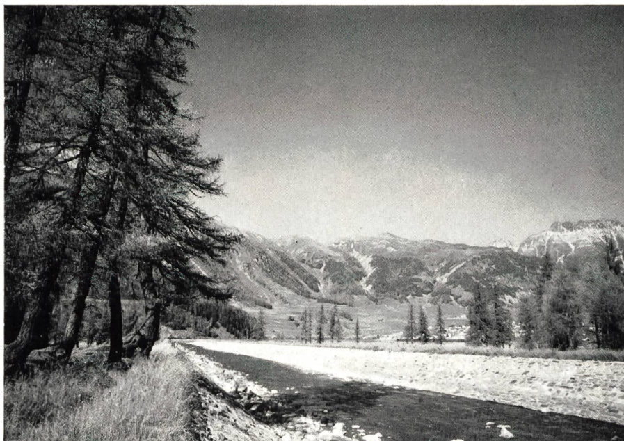
Bild 27 Der mit erhöhten Wuhren kanalisierte Flaz zwischen Punt Muragl und seiner Mündung in den Inn. Im Hintergrund rechts Dorfteile von Samedan und Crasta Mora.

Die kanalisierte Strecke von Inn und Flaz durch die Oberengadiner Ebene bildet notgedrungen keinen Beitrag zur Verschönerung des Landschaftsbildes. Es sind aber längs der Dämme gruppenweise für über 30 000 Fr. Bäume und Sträucher gepflanzt worden. Sobald diese eine gewisse Grösse erreicht haben, werden sie zusammen mit der Begrünung der Dämme und der Patina der Böschungspflasterung beitragen, die nackten Wuhrdämme etwas zu verdecken und das Landschaftsbild natürlicher zu gestalten.