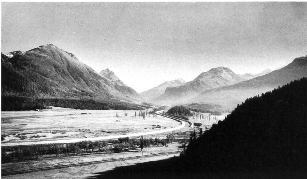
Bild 28 Die Talebene im Geländedreieck Punt Muragl — Celerina — Samedan mit erhöhten Wuhrbauten am Flaz. Blick auf Schafberg — Piz Albris — Berninapasslücke — Piz Chalchagn.