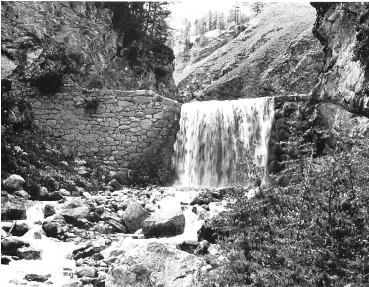
Bild 26 Eine der zahlreichen Schutzsperrn zur Sohlenfixierung des wilden Rosegbaches.