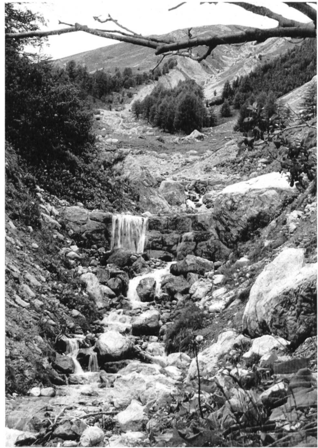
Bilder 24 und 25 Hochwassersperrn in Trockenmauerwerk in Val Zuondra ob Celerina. Dieses stark erodierte Wildbachtobel — ein Seitental des vom Schlattainbach durchflossenen Val Saluver — stellt eine stete Bedrohung des stattlichen Dorfes Schlarigna/Celerina dar; nach den Verheerungen von 1944 wurden wieder kostspielige Verbauungen im Unterlauf des Schlattainbaches durchgeführt.

Vergleicht man diese Hochwassersperrn mit den von Prof. Dr. ing. R. Müller, ETH/Zürich, in seinem Bericht «Generelle Beurteilung der flussbaulichen Verhältnisse im Einzugsgebiet des Inn- oberhalb S-chanf» 2 theoretisch errechneten Hochwassersperrn, so könnte man den Schluss ziehen, dass das Verbauungsprojekt 1956 der Inn-Flaz-Korrektion für eine zu niedrige Hochwassermenge dimensioniert wurde. Dem ist aber nicht so.