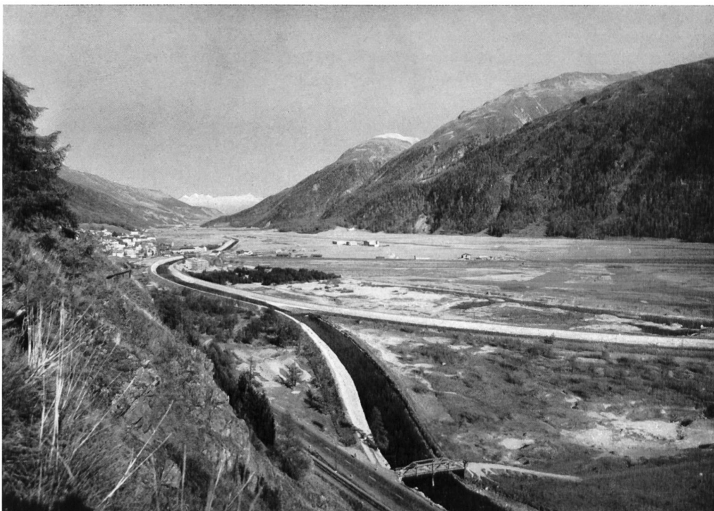
Bild 29 Der Inn, nach der Punt dals bouvs, und der von rechts einmündende Flaz nach den Hochwasserschutzbauten des Projektes 1956. Links das Dorf Samedan, rechts die weite Talebene «Champagna» mit dem Zivil- und Militärflugplatz; im Talhintergrund der Munt Baselgia ob Zernez.