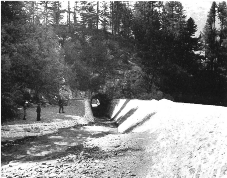
Bild 23 Umleitung des Surlejbaches durch einen Felsstollen und Abfluss in den Silvaplanersee zum Schutze des früheren Weilers Surlej.