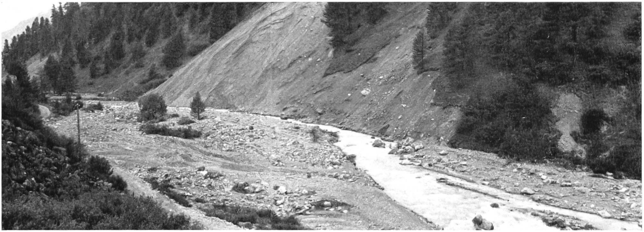
Bild 19 Grosse Hanganrisse und Schuttablagerungen des Hochwassers von 1954 am Muot da Crasta im hinteren Rosegtal.