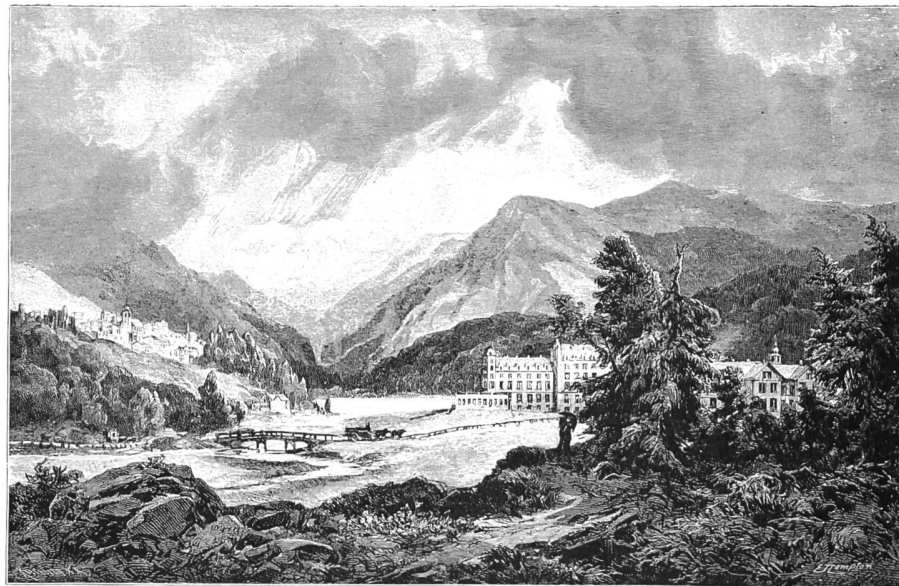
Bild 89 Alter Stich von St. Moritz-Bad; links im Bild ist St. Moritz-Dorf sichtbar.