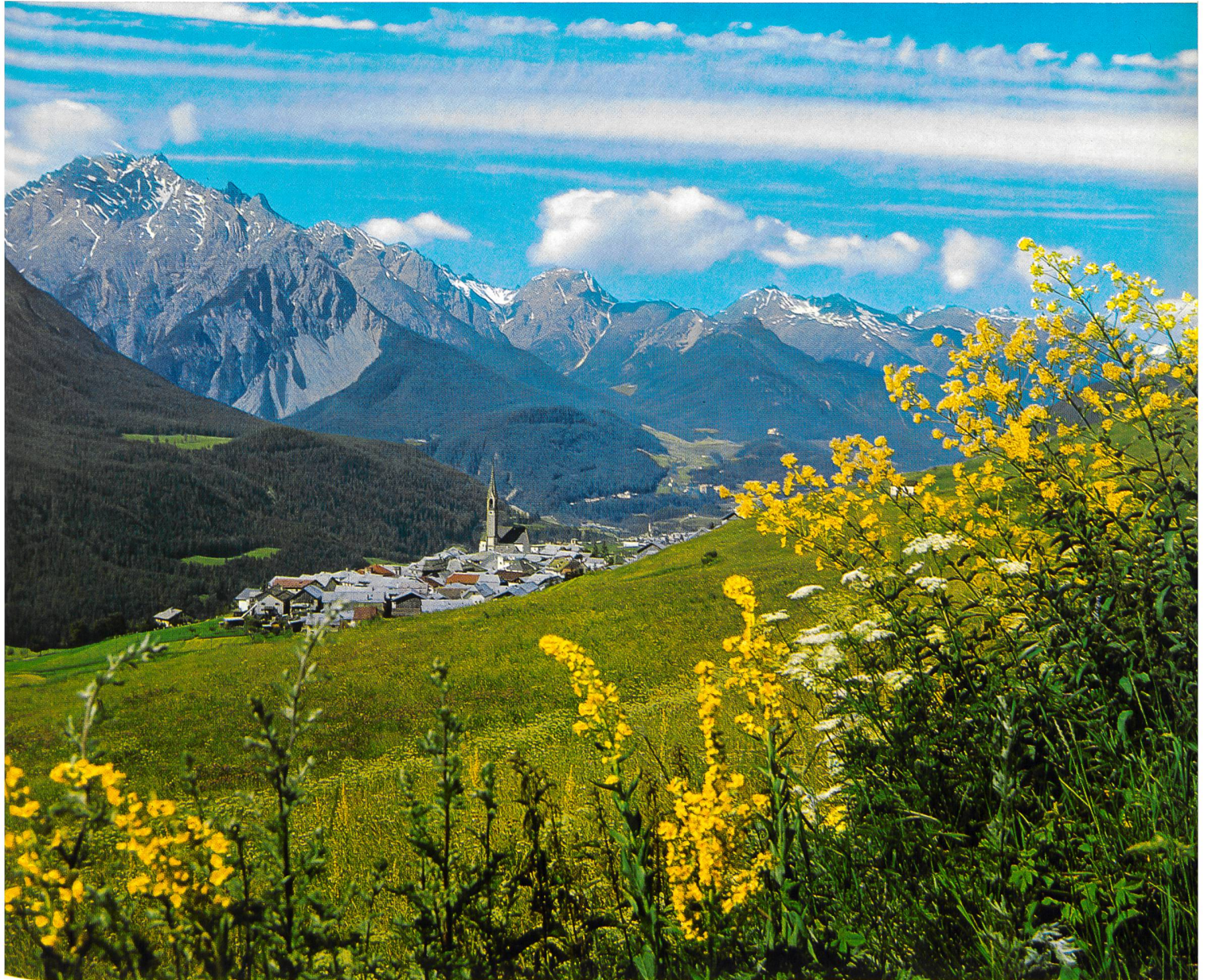
Blumenpracht beim Dorf Sent im Unterengadin mit Piz Pisoc-Gruppe.