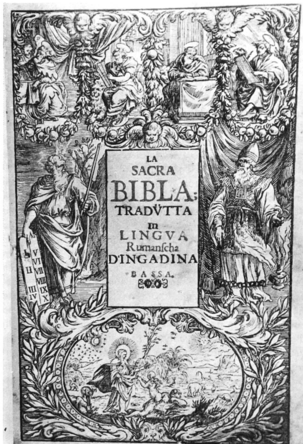
Bild 95 Titelblatt der im Idiom des Unterengadins übersetzten Bibel aus dem Jahre 1679

Zwar hatte der Engadiner Staatsmann und Humanist