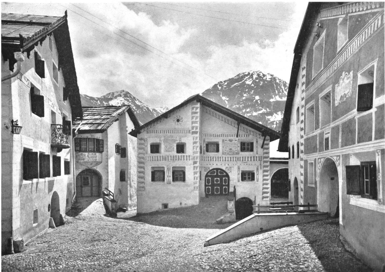
Bild 97 Charakteristischer Dorfplatz in Guarda, umrahmt von schönen, mit reichen Ornamenten verzierten Engadinerhäusern

Die dort einsetzende, neue Richtung des engadinischen Geisteslebens und besonders der Literatur verdankt wiederum äusseren Impulsen ihre Entstehung. Doch hätte sie wohl nicht jene Ausmasse angenommen, wenn nicht eine innere Entwicklung eine Atmosphäre besonderer Empfänglichkeit für diese äusseren Impulse geschaffen hätte.