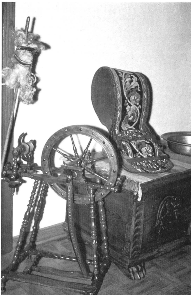
Bild 98 Spinnrad, alte Truhe und Kuhglocke mit reichbesticktem Gurt in einem Engadiner Heim

An die 3000 Auswanderer — der grösste Teil davon Engadiner — sahen sich ihrer Erwerbsquellen beraubt und kehrten vorübergehend in ihre Heimat zurück. Mit ungebrochenem Unternehmergeist zogen sie aber erneut aus und gründeten neue Geschäfte, vorab Kaffeehäuser, aber auch Lebensmittelgeschäfte, in ganz Italien, in Frankreich, in Deutschland, in den nordischen Staaten, in Polen und Russland. Die Erfahrungen mit der Serenissima mochten den Hang, die Bindungen zum Heimatdorf nicht abbrechen zu lassen noch verstärkt haben. Jedenfalls kehren die meisten Auswanderer periodisch wieder in die Heimat zurück und hoffen, dort in der Gemeinschaft des Dorfes, ihren Lebensabend verbringen zu können. — Seit dem Beginn des 19. Jahrhunderts nimmt die Emigration immer grössere Ausmasse an. In Silvaplana sollen um diese Zeit 28 Zuckerbäckerfamilien gelebt haben, wobei sich 66 ihrer Familienmitglieder im Ausland aufhielten, mehr als ein Viertel der damaligen gesamten Einwohnerschaft des Dorfes. Es gab Dörfer, deren Emigranten gewisse Gegenden bevorzugten, so Sent in der Toscana, Scuol Trieste. Oft geschah es, dass sich mehrere Familien am ausländischen Geschäft beteiligten, oft entstanden auch Kooperativgesellschaften, wodurch der in der Bauerngemeinde stark entwickelte Sinn für das gemeinschaftliche Vorgehen auch hier seinen schönsten Ausdruck findet. Diese Lösungen ermöglichten dem einzel-