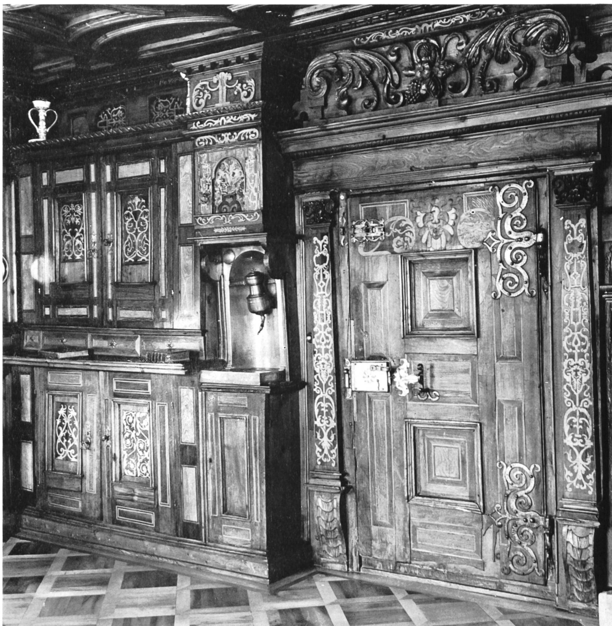
Bild 103 Beispiel einer besonders schönen Engadinerstube mit reichem Intarsienschmuck im Haus Gensler in Samedan; typisches Buffet mit Handwaschbecken und Wasserbehälter aus Zinn

engadinische und Gudench Barblan, neben Balsler Puorger, fürs Unterengadinische eine erste Richtung gegeben hatten, folgt zunächst Schimun Vonmoos, der Pfarrer aus Ramosch. Er versteht es, in seinen von feiner Ironie getragenen Erzählungen das Element der burlesken, humorvollen mündlichen Erzählertradition mit der religiösen, besinnlichen Richtung der älteren Literatur zu einer glücklichen Synthese zu verbinden. Eine ähnliche Wirkung erreicht Ursina Clavuot, mit ihren Erzählungen, in welchen die Verbundenheit ihrer Gestalten mit der früheren Tradition der Oberengadiner in feinsten Weise durchschimmert. Von psychologischen Problemen, besonders im Zusammenhang mit dem Menschentypus des Auswanderers, fühlt sich Selina Chönz aus Samedan/Guarda in besonderer Weise angezogen.