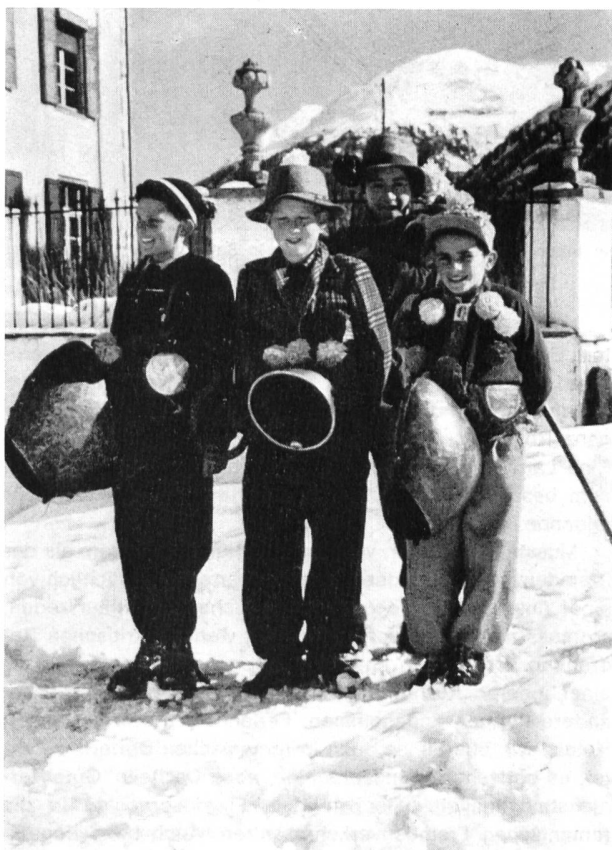
Bilder 101 und 102 Der uralte Brauch des Frühlingseinläutens am 1. März — der von den Engadiner Schulbuben stets so ersehnte Chailanda Marz — geht vielleicht auf das römische Neujahrsfest zurück. Es handelt sich um einen der wenigen Bräuche, die sich im ganzen Engadin noch erhalten haben. Das Tragen der Kuhglocken und das monatelang trainierte Peitschenknallen gehören zum besonderen Stolz.