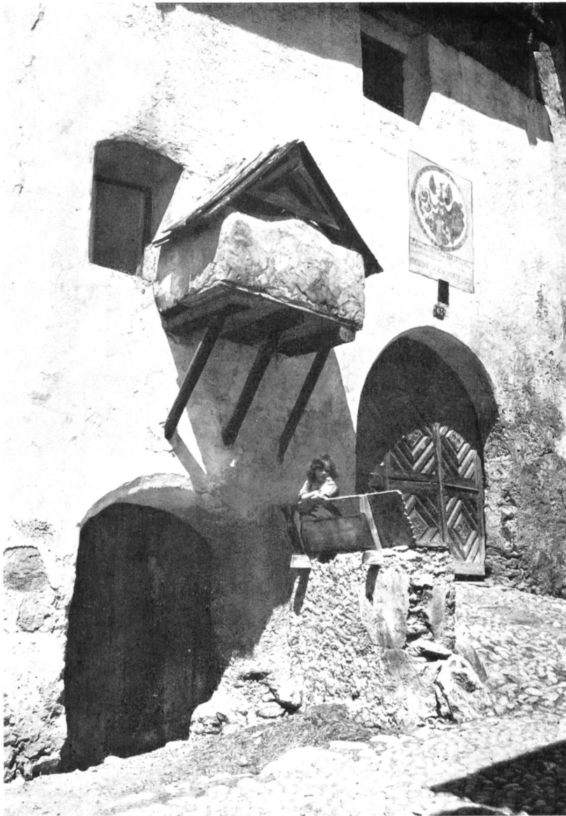
Bild 100 Bei alten Engadinerhäusern im Unterengadin — hier handelt es sich um ein Haus in Scuol/Schuls — ist noch da und dort der Brotbackofen sichtbar, dessen Ausbuchtung deutlich die Hausfassade durchbricht