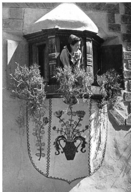
Bild 92 Beim Engadinerhaus sind die hübschen Erker und die Hängenecken — die hellrotafarbenen Engadinernecken — besonders charakteristisch.

In jeder Sprache begegnet man Wörtern, deren Wiedergabe in einer andern Sprache auf besondere Schwierigkeiten stösst. Eine bequeme, wörtliche Entsprechung fehlt, und es bleibt einem nichts anderes übrig, als sich mit einer mehr oder weniger glücklich formulierten Umschreibung zu begnügen. Umschreibend muss man versuchen, beim Zuhörer oder beim Leser annähernd dasselbe Bild zu erzeugen, dieselben Empfindungen zu wecken, dieselbe Atmosphäre zu schaffen, die dem wiederzugebenden Wort eigen sind. Fürwahr, ein nicht ganz einfaches Unterfangen! Denn gerade bei diesen, der simplen Uebersetzung, der Substitution, widerstrebenden Wörtern handelt es sich oft um typische Gebilde, um Ausdrücke, die das Besondere, das Wesenhafte, ja vielleicht das Einmalige einer Kultur in sich bergen.