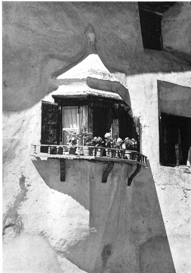
Bild 99 Reizvoll gestalteter Erker in Ftan

nen Auswanderer, seine schwere Arbeitslast von Zeit zu Zeit einem Kompagnon zu übergeben und sich für einige Monate, vielleicht auch für ein Jahr und mehr zu seiner Familie ins Heimatdorf zurückziehen.