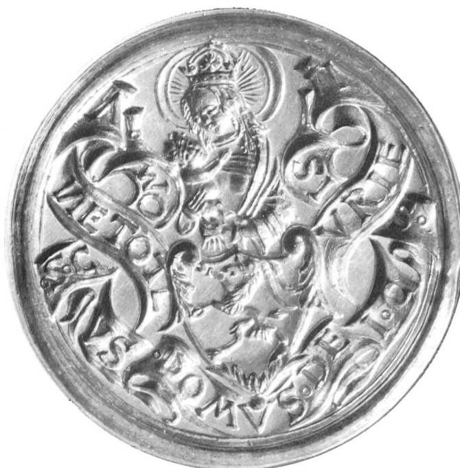
Bild 104 Altes Siegel des 1367 in Zernez und Chur geschlossenen Gotteshausbundes

Dies mahnt zum Aufsehen. Dies mahnt ebenso sehr wie jener Wald zuhinterst im Val S-charl. Es mahnt verhaltener. Sicher, jeder Mensch des 20. Jahrhunderts trägt ein wenig die Empfindung der «suldüm», der Verlassenheit, in sich. Doch im Rahmen der Geistesgeschichte und der Kultur des Engadins enthält diese Empfindung auch die deutliche Aufforderung, das Besondere, das Wesenhafte dieser Kultur, so weit dies erreichbar ist, in jener Frische zu erhalten, die ihr auch weiterhin ermöglicht, Neues in der ihrer Gemeinschaft eigenen Weise zu verarbeiten und zu formen.