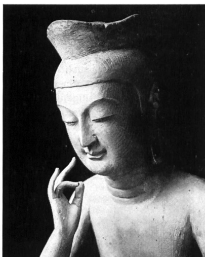
Bild 1 Lehrender Buddha, eine der ältesten japanischen Holzschnitzereien (7. Jahrh.) im Koryuji-Tempel, Kyoto.

Bis vor 100 Jahren war die westlichste Hafenstadt Nagasaki das einzige Bindeglied zwischen Asien und zwischen Europa. Erst als 1869 die Neuorientierung zum Industriestaat einsetzte, begann die Berührung mit der Umwelt und die Auswanderung. Nachdem diese aber durch die USA, Kanada und vor allem durch Australien unterbunden wurde, orientierte sich die japanische Expansion nach Formosa, Süd-Sachalin, Korea und nach der Mandschurei, und zwar unter dem Druck der Rohstoffarmut einerseits (abgesehen von Schwefel verfügt Japan nur über etwas Kupfer, Zink, Gold und Silber; 90 Prozent der industriellen Rohstoffe werden im-