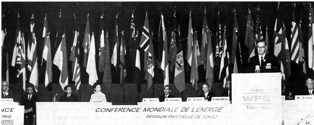
Bild 2 Eröffnungsfeier der 15. Teiltagung der Weltkraftkonferenz in Gegenwart des japanischen Kronprinzenpaares. Am Rednerpult der Präsident der Weltkraftkonferenz, W. H. Connolly, Australien.

kraftkonferenz verbundenen Kreise. Mit der sprunghaften Zunahme des Energieverbrauchs in den letzten 15 Jahren gewinnt das Problem der Vorausschätzung des Energiebedarfs an Bedeutung. Jedoch wird es mit der stets engeren Verflechtung der energiewirtschaftlichen Probleme mit den volkswirtschaftlichen Aspekten und mit der fortschreitenden Substitution der klassischen Energieträger durch arbeitssparende Energieformen bedeutend schwieriger, allgemein gültige Methoden zu finden.