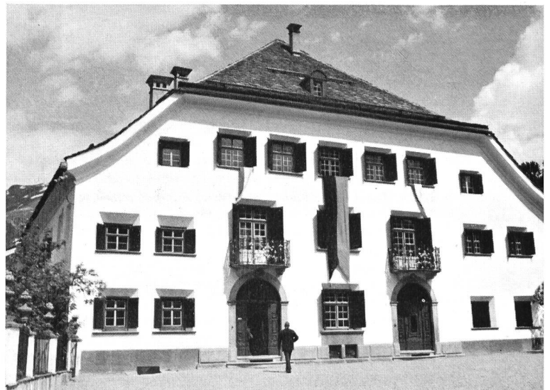
Bild 2 Chesa Planta, typisches Engadiner Patrizierhaus in Samedan, in welchem u.a. die romanische Bibliothek untergebracht ist.