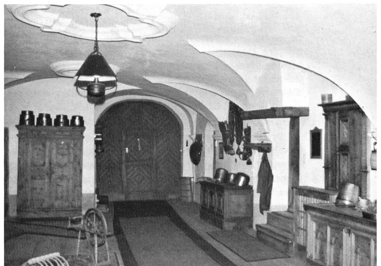
Bild 3 Engadiner Sulèr im Haus Pianto in Samedan.