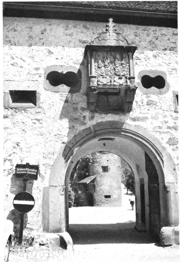
Bild 1 Eingang zum Schloss Eberstein im nördlichen Schwarzwald.

Der Nachmittag galt einer abwechslungsreichen Carfahrt durch lange, stark bewaldete Täler des nördlichen Schwarzwaldes bis nach Erzgrube zur Besichtigung der im Bau stehenden Nagoldtalsperre. Das obere Einzugsgebiet der Nagold und ihrer Seitenbäche Waldach und Steinach ist gekennzeichnet durch aussergewöhnlich starke Abfluss-Schwankungen – bei der Sperstelle variieren diese zwischen nur 0,11 m 3 /s und 40 m 3 /s