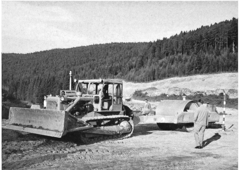
Bild 3 Grosse Walze auf dem nahezu vollendeten Erddamm der Nagoldtalsperre.