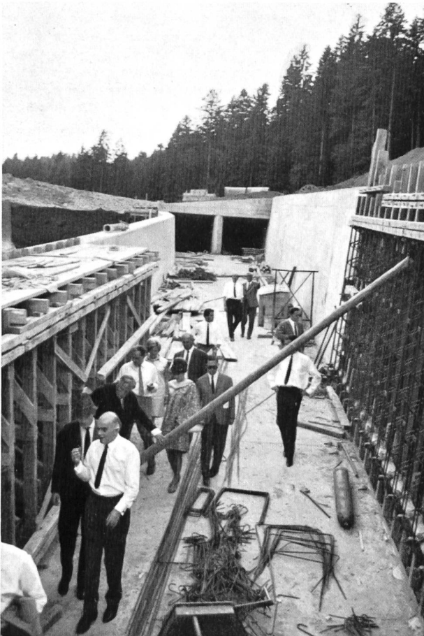
Bild 2 Schussrinne für Hochwasserentlastung an der Nagoldtalsperre.