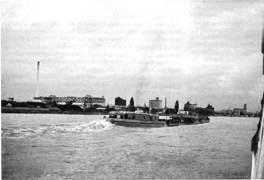
Im Hafен- und Industriegebiet Basels bei Hochwasser führendem Rhein.