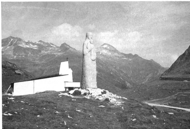
Bild 4 Auf der Passhöhe des Lukmanier wurde durch die KVR neben einer Marienstatue eine kleine moderne Kapelle Sta. Maria errichtet, nachdem die alte Hospizkapelle durch die Schaffung des Stausees Sta. Maria geopfert werden musste.