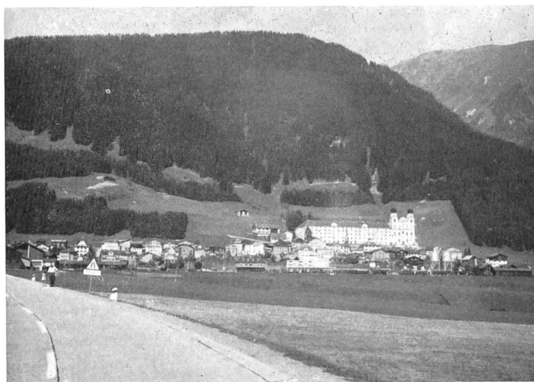
Bild 5 Das die grosse Siedlung Disentis/Mustèr dominierende Benediktiner-Kloster