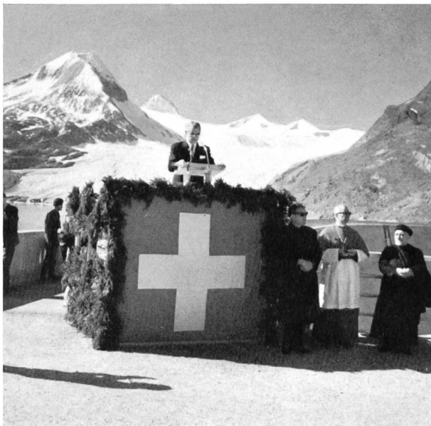
Bild 2 Ansprache anlässlich der feierlichen Einweihung der Staumauer auf nahezu 2400 m ü.M.

Dem Prospekt der Wasserkraftanlage entnehmen wir u.a. nachfolgende Angaben: Das augenfälligste Merkmal der Anlagen ist die auf dem Felsriegel zwischen Faulhorn und Nufenenstock aufgebaute Betongewichtsmauer des Speicherbeckens Gries. Der Stausee Gries hat ein Einzugsgebiet von 10,5 km 2 und ist heute der höchstgelegene Stausee der Schweiz. Als Abschlussmauer der natürlichen Talmulde am Fusse der Gletscherzunge dient eine 60 m hohe, leicht gekrümmte Gewichtstalsperre von 400 m Kronenlänge, welche ein Betonvolumen von 259 000 m 3 erforderte.