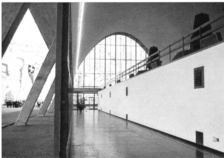
Bilder 3 und 4 Innenansichten der aussergewöhnlich elegant konzipierten Zentrale Nuova Biaschina.