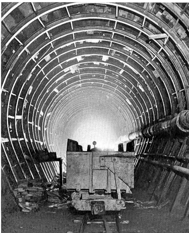
Bild 4 Einbau in der Bergschuttstrecke Pinaderio des Freilaufstollens Olivone-Malvaglia.

Das Speicherbecken Luzzone von 87 Mio m 3 Nutzinhalt bildet das Kernstück der ganzen Werkgruppe. Sein Stauziel liegt auf Kote 1591 m; die tiefste Absenkung auf Kote 1435 m. Bei Vollstau misst die Seeoberfläche 1.235 km 2 . Am Ausgang des beim Dorfe Campo von Osten ins Haupttal mündenden Val Luzzone, wo sich die Talflanken zu einer V-förmigen Schlucht verengen, erhebt sich die Talsperre, eine Bogenmauer von 208 m grösster Höhe, 530 m Kronenlänge und einem Betonvolumen von 1 330 000 m 3 . Der Bauauftrag mit einer Kostensumme von über 100 Millionen Franken wurde im Frühjahr 1958 erteilt; die Talsperre war am Ende der Bausaison 1962 fertigbetoniert. Nach einem Teilstau des Beckens im Sommer 1962 wurde die Anlage mit einjährigem Vorsprung auf das Programm zur Aufnahme des ersten Vollstaus im Sommer 1963 bereitgestellt. Die geologischen Gegebenheiten der Sperrstelle erforderten einen verhältnismässig grossen Fundamentaushub von 1 100 000 m 3 . Das Kiessandmaterial wurde von einem Baggerfeld im benachbarten Val Camadra unterirdisch mittels in den künftigen Wasserzuleitstollen verlegten Förderbändern zugeführt; der Zement wurde ab Bahnhof Biasca auf Strassenfahrzeugen mit Silobehältern auf die Baustelle gebracht.