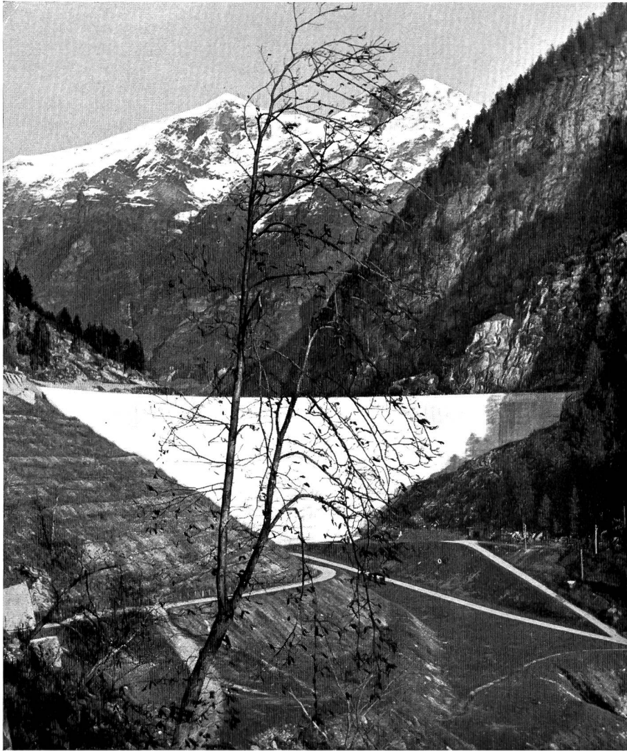
Bild 6 Ansicht der 92 m hohen Bogenstaumauer Malvaglia, die einen Speicherraum von 4 Mio m 3 geschaffen hat. In diesen Speicher mündet der lange, von Olivone kommende Freilaufstollen.