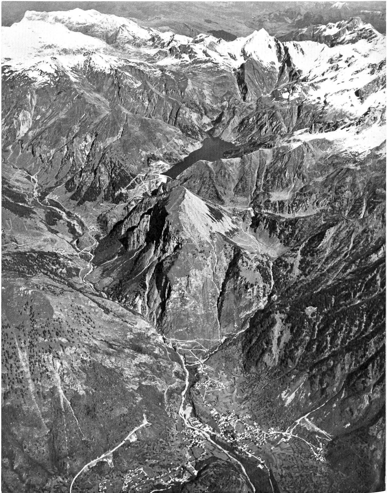
Bild 2 Flugbild des obern Bleniotales. Im Vordergrund Olivone mit der Strassenzufahrt nach Luzzone bis zum Eingang des Toiratunnels. Die Zentrale Olivone befindet sich im Sostomassiv (Bildmitte). Links die Dörfer Campo und Ghirone. In Bildmitte die Staumauer und das Speicherbecken Luzzone. Im Hintergrund mit Schnee der Piz Terri, der Greinaboden und die Ausläufer der Medelsergruppe.