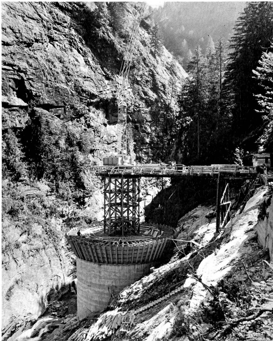
Bild 5 Erstellung des Ueberlaufbauwerks beim Ausgleichbecken Malvaglia.

Nach den Ergebnissen der ersten Betriebsjahre ist mit Jahreskosten von rund 25,5 Millionen Franken zu rechnen, das heisst mit einem Aufwand von rund 6,8% der Anlagekosten. Der mittlere Gestehungspreis der Energie beträgt 2,75 Rp./kWh, der Winterenergiepreis 3,6 Rp./kWh unter Einrechnung eines Ertragswerts für die Sommerenergie von 2 Rp./kWh. Mit diesem vorzüglichen Wirtschaftlichkeitsergebnis reiht sich die Blenio Kraftwerke AG unter die günstigsten Produktionsanlagen unseres Landes.