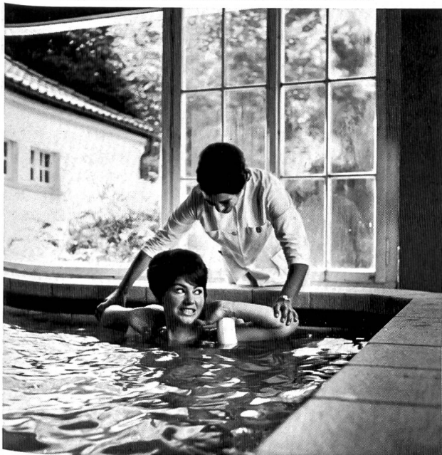
Bild 7 Heilgymnastik im Thermalschwimmbad Schinznach.

hältnis der verschiedenen Stoffe. Es ist nun unbestreitbar nachgewiesen, dass nicht nur gasförmige Substanzen durch die Haut aufgenommen werden, sondern auch eine echte Ionenresorption stattfindet. Obwohl der Weg dieser Stoffe im Körper und ihr Einbau in verschiedene Gewebe mit Hilfe radioaktiver Isotope verfolgt werden kann, scheint sich doch ein grosser Teil ihrer Wirkung in der Haut selbst abzuspielen (Verbesserung der Hautdurchblutung, Aktivierung oder Hemmung von Fermentsystemen).