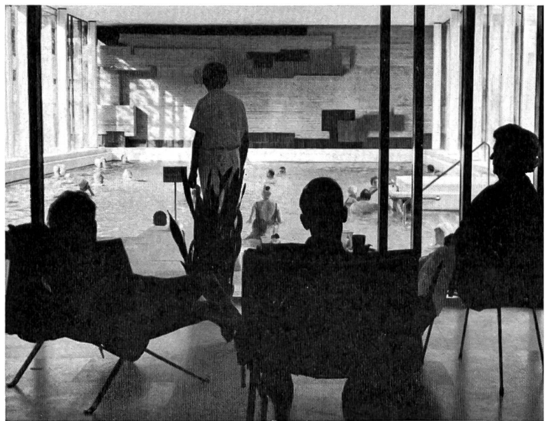
Bild 1 Thermalschwimmbad Baden

Es ist aber nicht nur von der Schliessung von Bädern zu berichten. In Zurzach ist ein neuer Badekurort entstanden. Am 19. Juli 1914 stiess man bei Bohrungen nach Salz und Kali in 416 Metern Tiefe ganz überraschend auf eine warme Quelle von 250—300 Minuten-Litern und 38,2 °C Temperatur. Obwohl das kantonale chemische Laboratorium in seinem Analysenbericht die Quelle als wertvoll bezeichnete, wurde das Bohrloch bereits am 27. Juli 1914 bis auf eine Tiefe von 416—362,44 m wieder verstopft, aus einer geologisch heute überholten Befürchtung heraus, die von der Sodafabrik benutzten Salzlager könnten geschädigt werden. Erst 1954 gelang es, die nötigen Mittel zur Wiedererbohrung der Quelle zusammenzubringen. Am 5. September 1955 trat nahe an der ursprünglichen Bohrstelle aus einer Tiefe von 429,6 m die Therme von 40 °C mit 7 Atmosphären artesischem Druck und 1700 Minuten-Litern Schüttung durch das