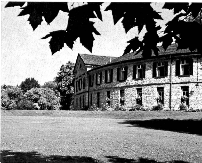
Bild 6 Bäder-Trakt in Schinznach.