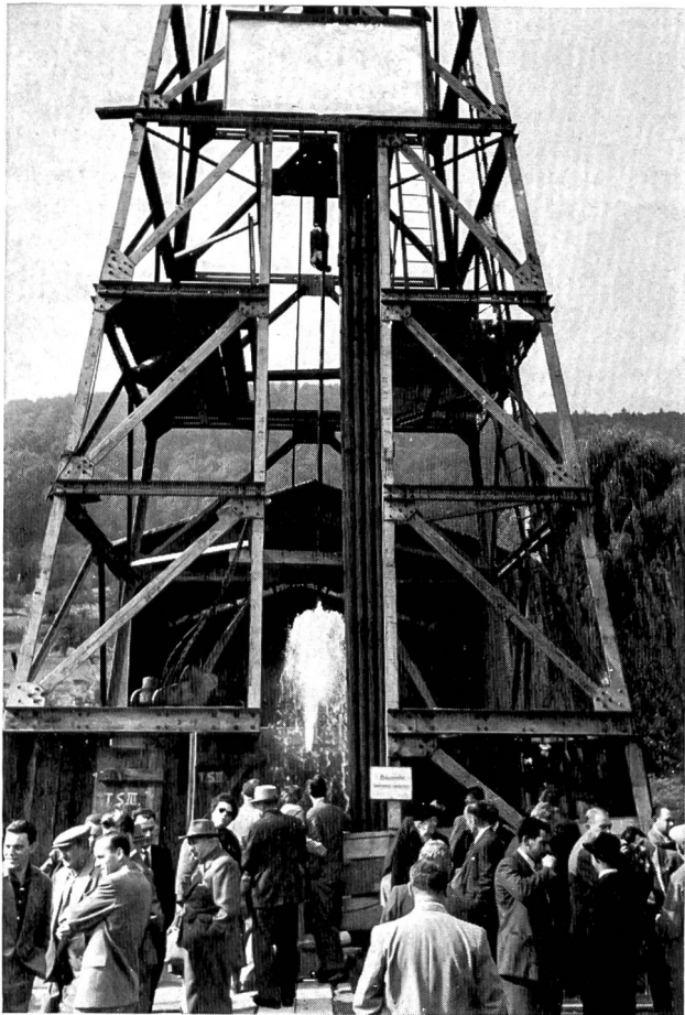
Bild 3 Erbohrung der Thermalquelle Zurzach, September 1955.