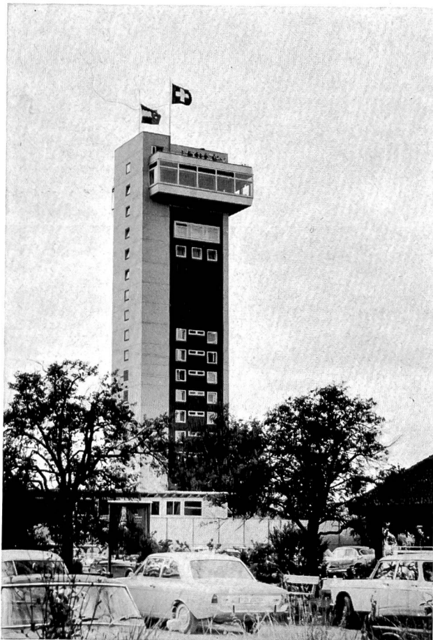
Bild 4 Turmhotel mit Wasserspeicher in Zurzach.

18,5 cm messende Bohrloch an die Oberfläche. Die relativ starke Querschnittsbeschränkung durch die Verrohrung und andere Einflüsse reduzierten später den Erguss auf 800 Liter/Min. Heute liefert die Quelle über zwei Bohrlöcher konstant 1000 Liter/Min.