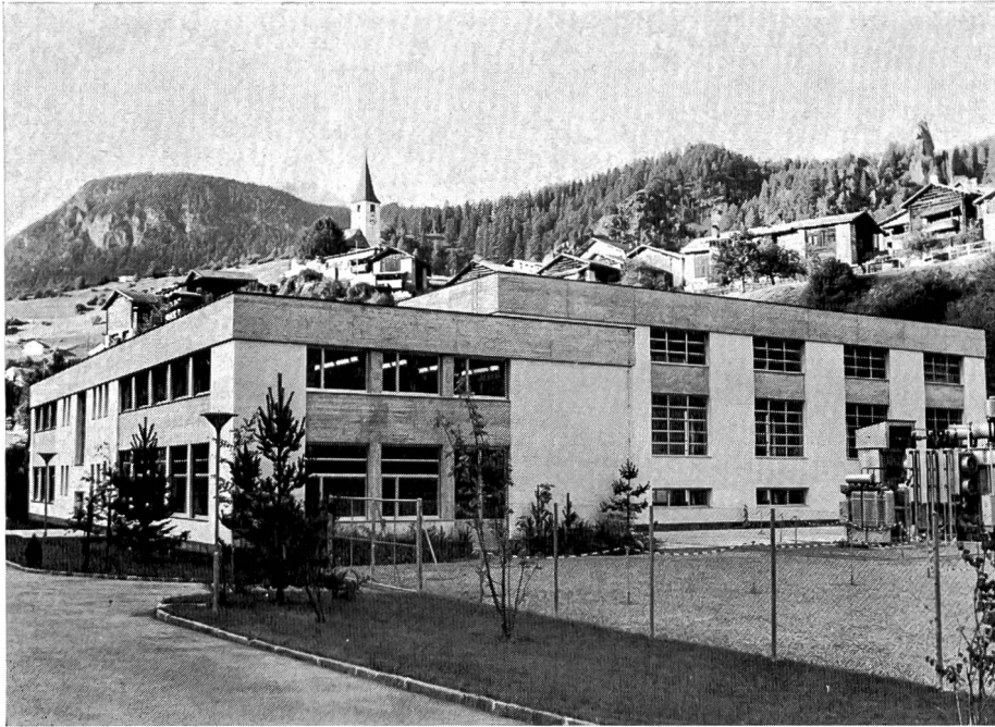
Bild 7 Zentrale Filisur und Dorfpartie