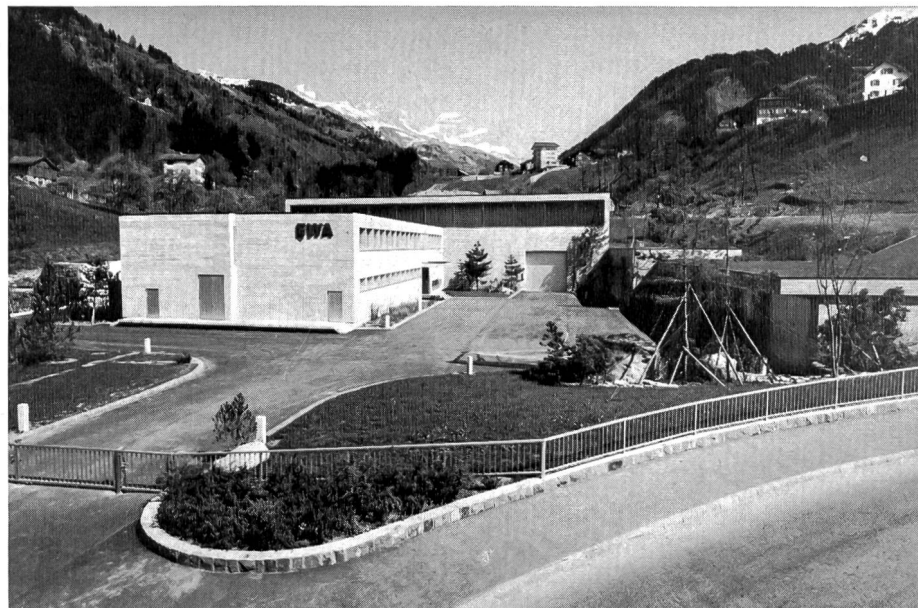
Bild 2 Zentrale Bürglen im Schächental; Blick gegen den Klausenpass und auf die Schächentaler Windgälle

miteinbezogen. Ferner werden die Abflüsse des Sulztalbaches direkt in den Druckstollen eingeleitet. Die Stufe Unterschächen-Bürglen verfügt über zwei Maschinengruppen. Das zwischen Unterschächen und Loreto anfallende Restwasser wird in einem Nebenwerk, in der Anlage Loreto-Bürglen, genutzt. Die Maschinengruppe dieser Stufe befindet sich ebenfalls in der neuen Zentrale. Eine Unterstation mit einer 15 kV- und 50 kV-Innenraum-Schaltanlage ist dem Kraftwerk Bürglen angegliedert. Sie übernimmt die Funktion der Verteilung der elektrischen Energie im Raum Alt-