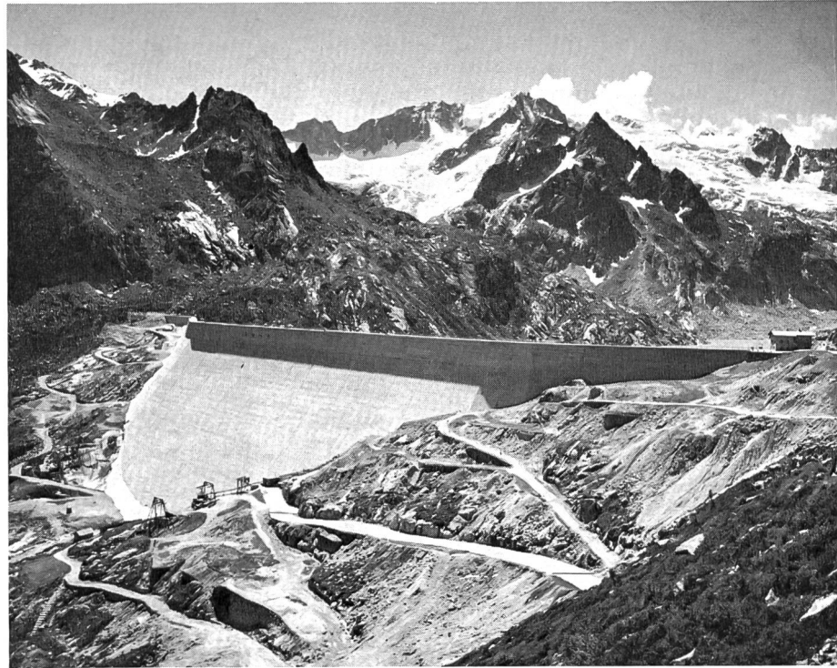
Bild 1 Die 115 m hohe Gewichtsstau- mauer Albigna im Bergell, das bedeutendste Bauwerk des EWZ. Im Hintergrund Cima di Cantone und Cima di Castello

den vergangenen Jahren einen systematischen Ausbau, so dass nicht nur allen steigenden Anschlussbegehren entsprochen wurde, sondern auch die Reserveleistungen erheblich verbessert werden konnten. Dadurch wurde auch ein hoher Grad an Versorgungssicherheit erreicht.