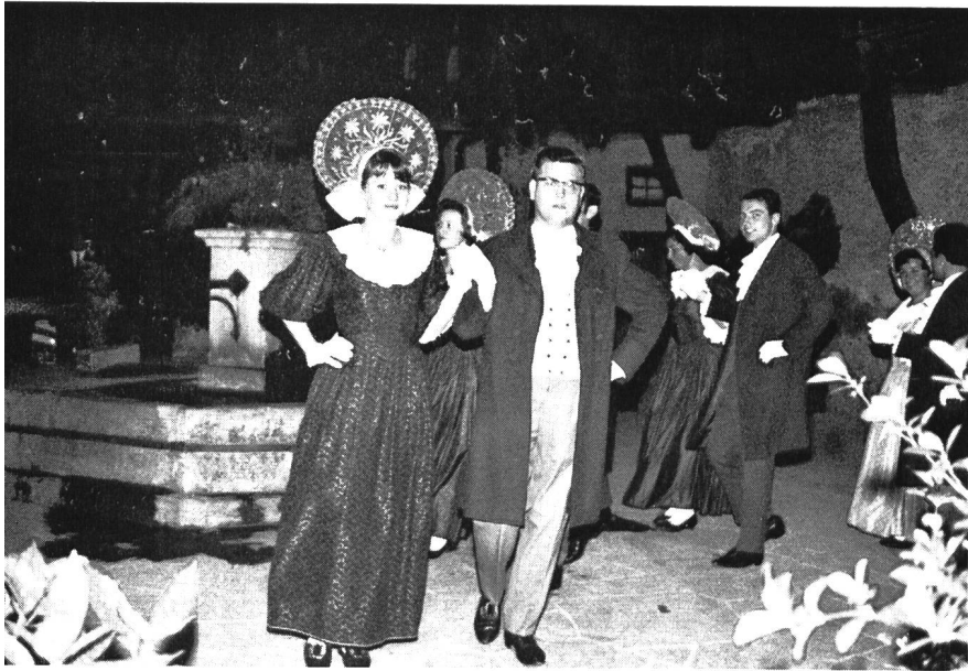
Empfang des Rheinverbandes im Hof der Schattenburg in Feldkirch

Bilder 1 bis 4 Tanzdarbietungen in einheimischer Tracht