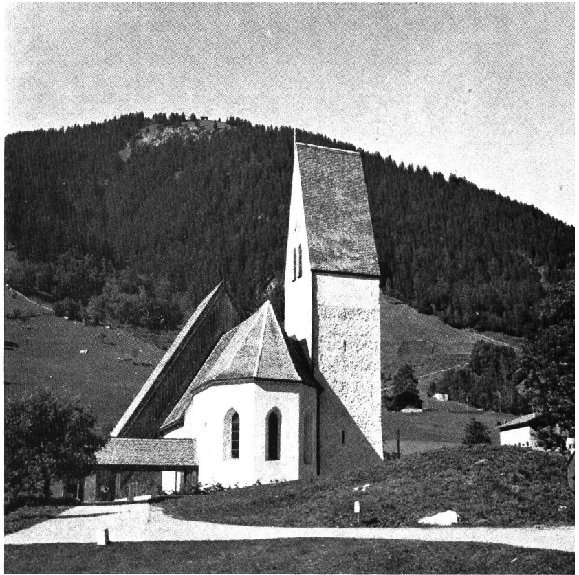
Bild 11 Umgebaute gotische Kirche der Ortschaft Brand in einem südlichen Seitental des Montafon