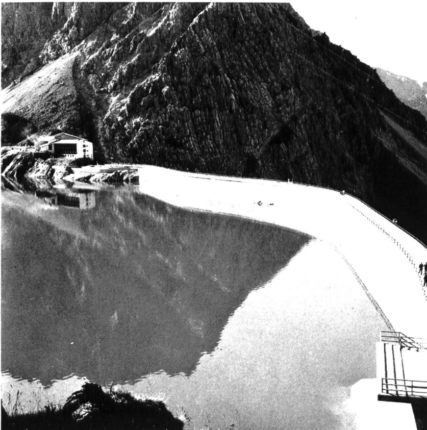
Bild 10 Lünensee mit Talsperre und Douglasshütte