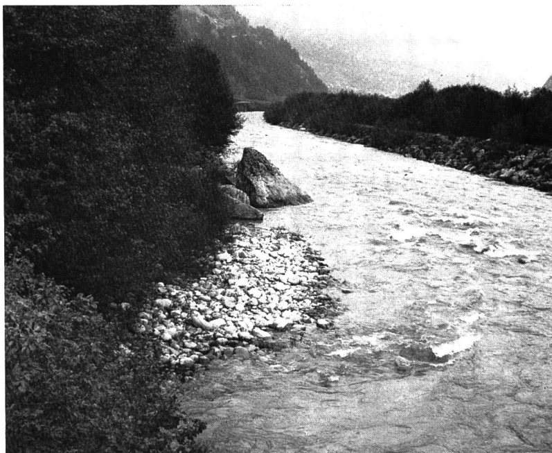
Bild 1 Verbauung des Vorderrheins bei Waltensburg, ausgeführt 1911/1913; Aufnahme vom 2. Juni 1970

während diejenigen des 1868er Hochwassers 36,5 % ausmachten. Das Vorderrheintal war von allen Gebieten Graubündens vom Hochwasser des Jahres 1868 am stärksten heimgesucht worden. Um sich ein richtiges Bild von der Grössenordnung dieser Schäden machen zu können, muss man diese Zahlen in Relation zum heutigen Geldwert bringen. Der Boden wurde damals mit 20 bis 30 Rappen pro m 2 eingeschätzt. Beispielsweise wurden sechs weggerissene Ställe in Medel/Lucm. alle zusammen mit Fr. 270 und eine Stampfmühle mit Fr. 180 bewertet. Beim heutigen Geldwert wären die Schadenssummen mindestens 20 Mal grösser ausgefallen.