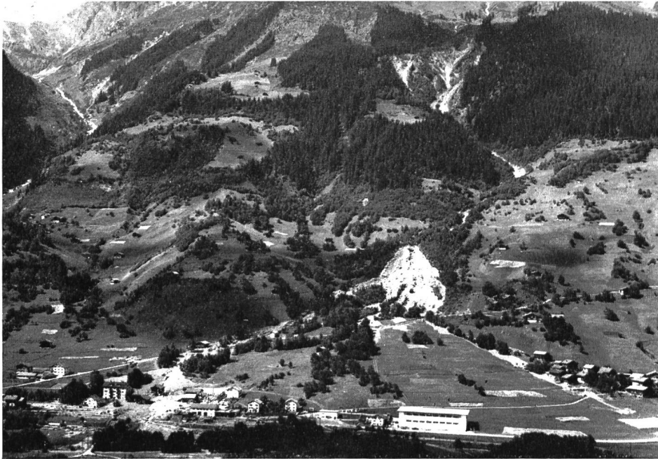
Bild 3 Röfen-niedergang vom 7. August 1962 aus dem Val Zinzera auf Häuser in Darvella, östlich von Trun

Die von den Hochwassern am meisten betroffenen Gebiete im Vorderrheintal waren die Ebenen von Surrhein, Trun und Ruis — Ilanz. Die weitaus grössten Schäden entstanden durch das Hochwasser des Valserrheins in der Gemeinde Vals. Sowohl bei Surrhein wie bei Trun und Ilanz mündeten die grössten rechtsseitigen Flüsse und Wildbäche in den Vorderrhein. Hinter den Schuttkegeln dieser Seitenflüsse bildeten sich die breiten Talböden von Surrhein, Trun und Ilanz. Da die grosse Geschiebeführung der Seitenflüsse eine Vertiefung des Rheinbettes verhinderte, wurden diese flachen Gebiete von den Hochwassern überflutet und daher entstanden hier auch die grössten Schäden.