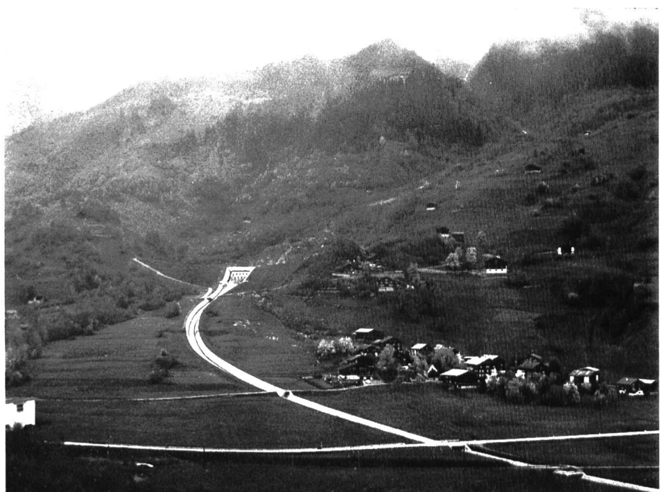
Bild 4 Verbauung der Val Zinzera, Gemeinde Trun, ausgeführt 1966/67, Aufnahme vom Juni 1970