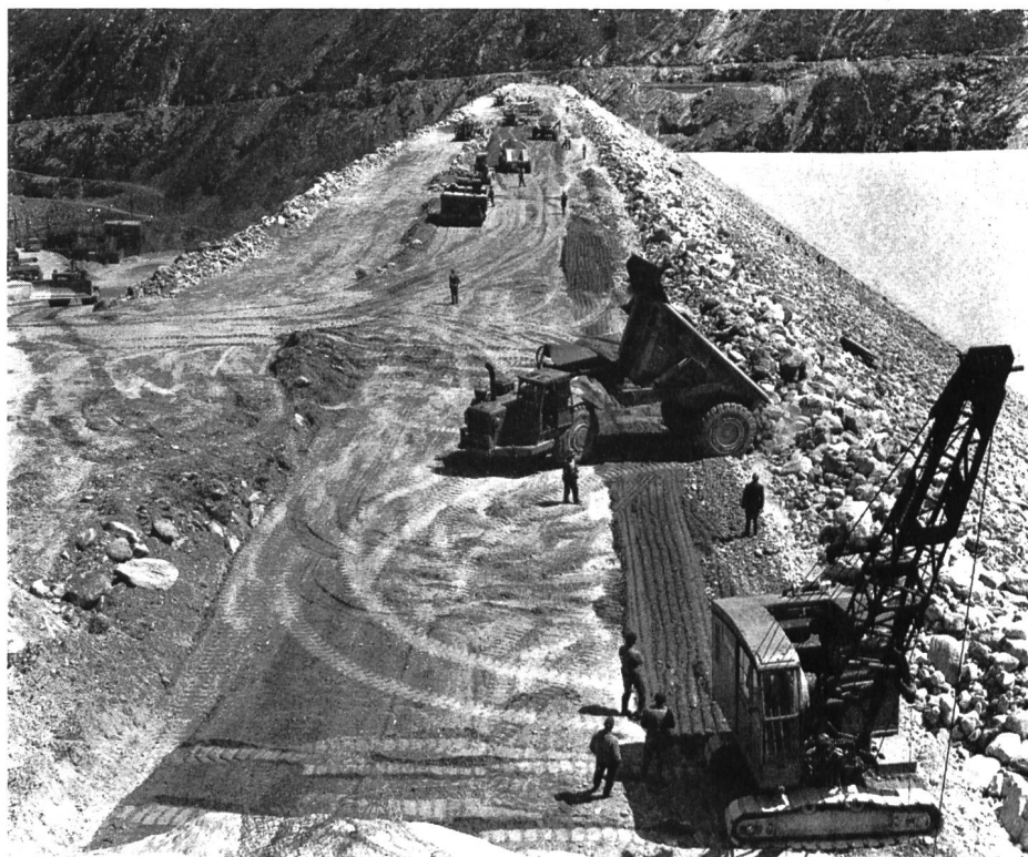
Bild 1 Staudamm Mattmark, Einbau des Materials in den verschiedenen Dammszonen auf der Höhe der Hochwasserentlastung

Die nachfolgenden kurzen Abrisse über die Entwicklung der drei Abteilungen der VAWE zeigen eindrücklich seine Leistungen als Direktor dieser Anstalt.