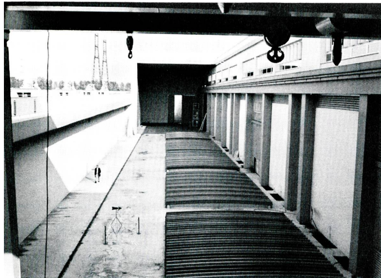
Bild 10 Abdachung der horizontalen Kaplan-turbinen (Rohrturbinen) beim Rheinkraftwerk Strassburg.

grossartigen Strassburger Münster geboten wird, währenddem die an den technischen Anlagen interessierten Exkursionsteilnehmer zum allerdings leider nur flüchtig möglichen Besuch des seit 1970/71 im Betrieb stehenden Rheinkraftwerks Strassbourg der EdF und der zugehörigen Schiffahrtsanlagen (Bilder 9, 10) fahren. Dieser Besuch ermöglicht es, sich ein gutes Bild auch des fertigen Kraftwerks Gamsheim zu