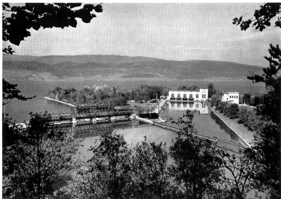
Bild 1 Die Wasserkraftanlage Hagneck an der Aare, das erste Kraftwerk der später gegründeten Bernischen Kraftwerke.