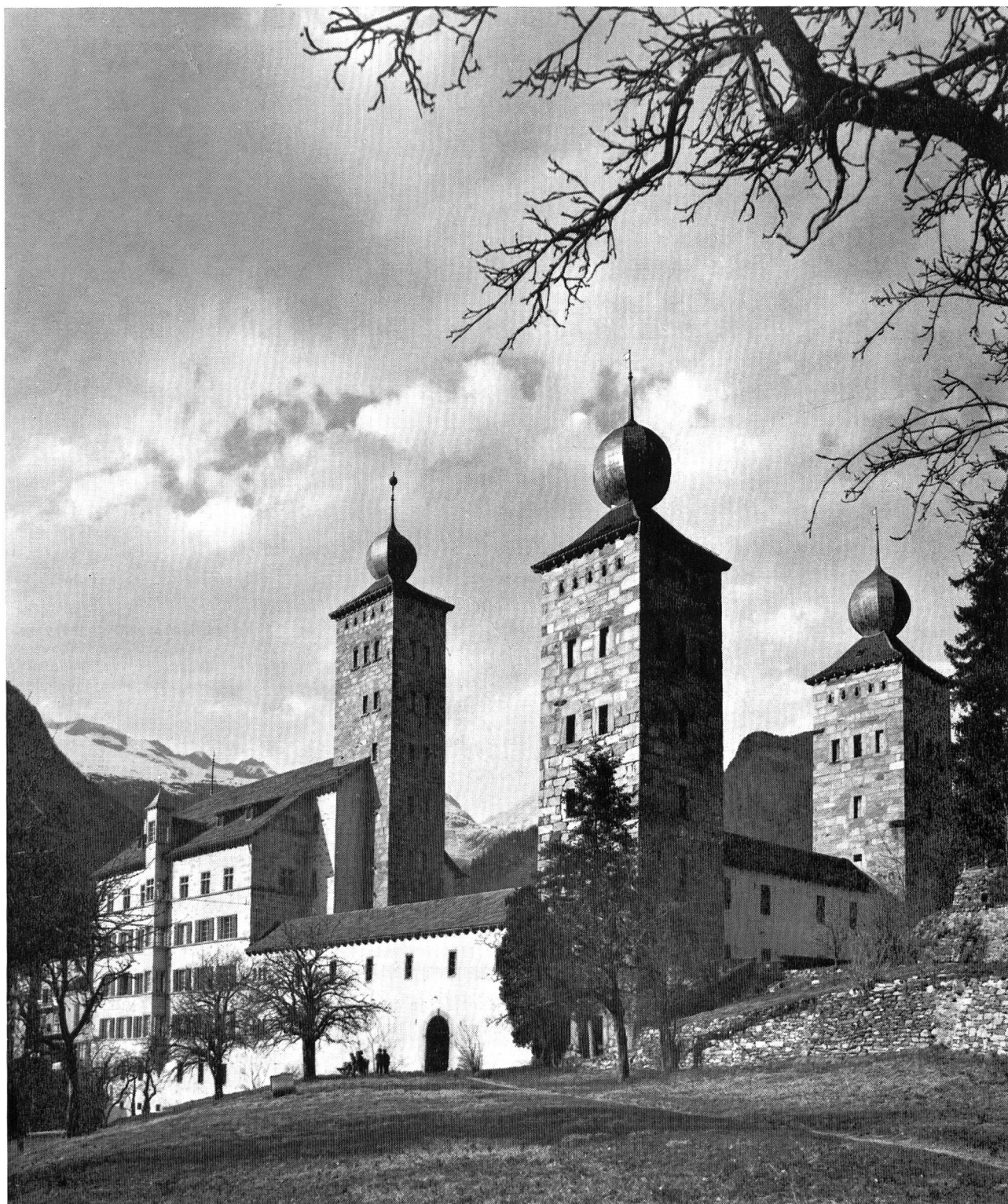
Der imposante, aus dem 17. Jahrhundert stammende Stockalperpalast in Brig, in welchem die Hauptversammlung zur Durchführung gelangt (Foto Schweizerische Verkehrszentrale, Zürich).

SCHWEIZERISCHER WASSERWIRTSCHAFTSVERBAND